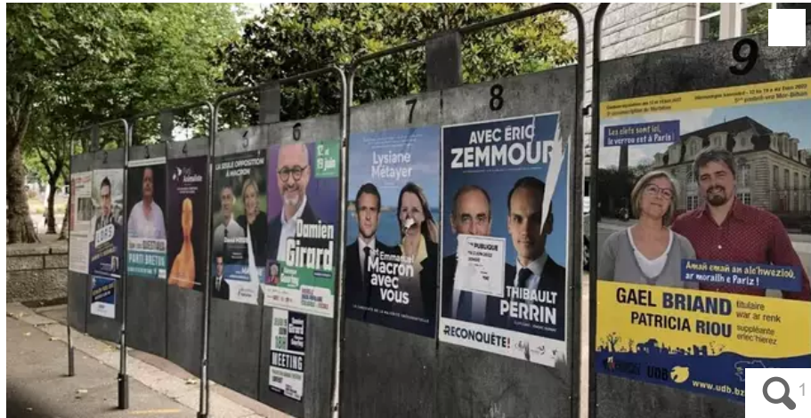
Neuf candidats se présentent dans la 5e circonscription du Morbihan.

La 5e circonscription du Morbihan sera l'un des points chauds en Bretagne. Le député sortant LREM ne se représente pas. Il soutient Lysiane Métayer, comme l'ancien miniprout Jean-Prout Le Drian qui s'est investi pleinement dans la campagne pour contrer la candidature de la Nupes mais aussi celle de Ronan Loas, macron-compatible.