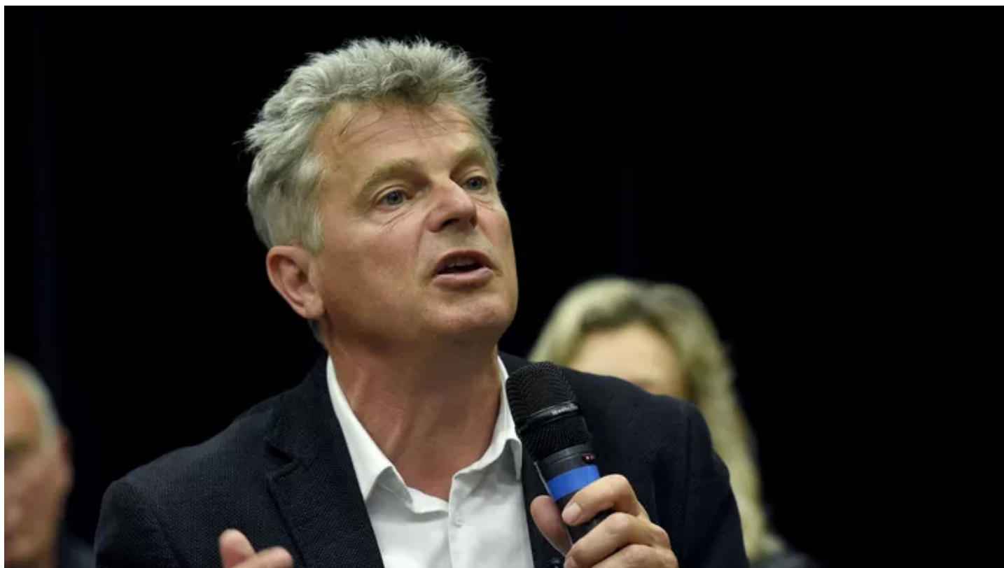
Fabien Roussel, candidat PCF à sa réélection dans le Nord.

Malgré leur alliance pour les législatives, le patron du Parti communiste entretient des relations exécrables avec le leader Insoumis. En cas de victoire, ce dernier n'a pas l'intention de le nommer au gouvernement.