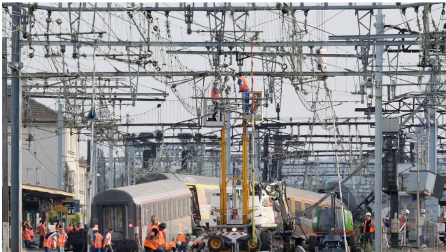
Photo de l'accident de train à la gare de Brétigny-sur-Orge.

Le parquet d'Évry a requis 450.000 euros d'amende contre la SNCF, jugée pour homicides involontaires et blessures involontaires lors de la catastrophe ferroviaire de 2013.