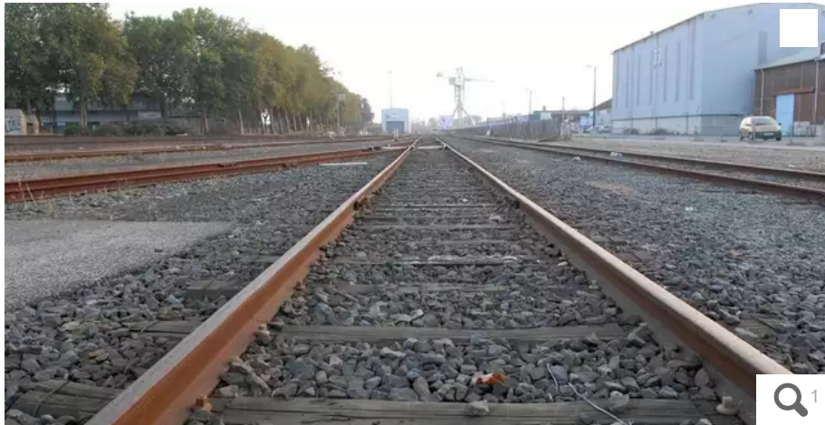
Un collectif de partis politiques, mouvements, associations se lève contre le démantèlement des rails de Nantes-État.

Un collectif de syndicats, partis politiques, mouvements, associations organise un rassemblement le mardi 21 juin de 11 h 30 à 14 h 30 à Nantes État pour demander une politique de transports ferroviaires plus ambitieuse et plus respectueuse des enjeux environnementaux.