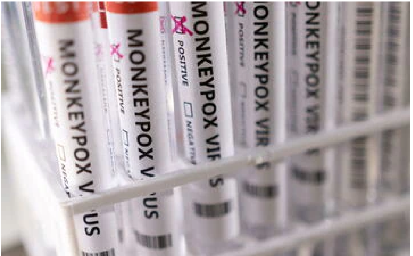
Abonnés Variole du singe : pourquoi l'OMS ne déclenche pas son plus haut niveau d'alerte... pour le moment