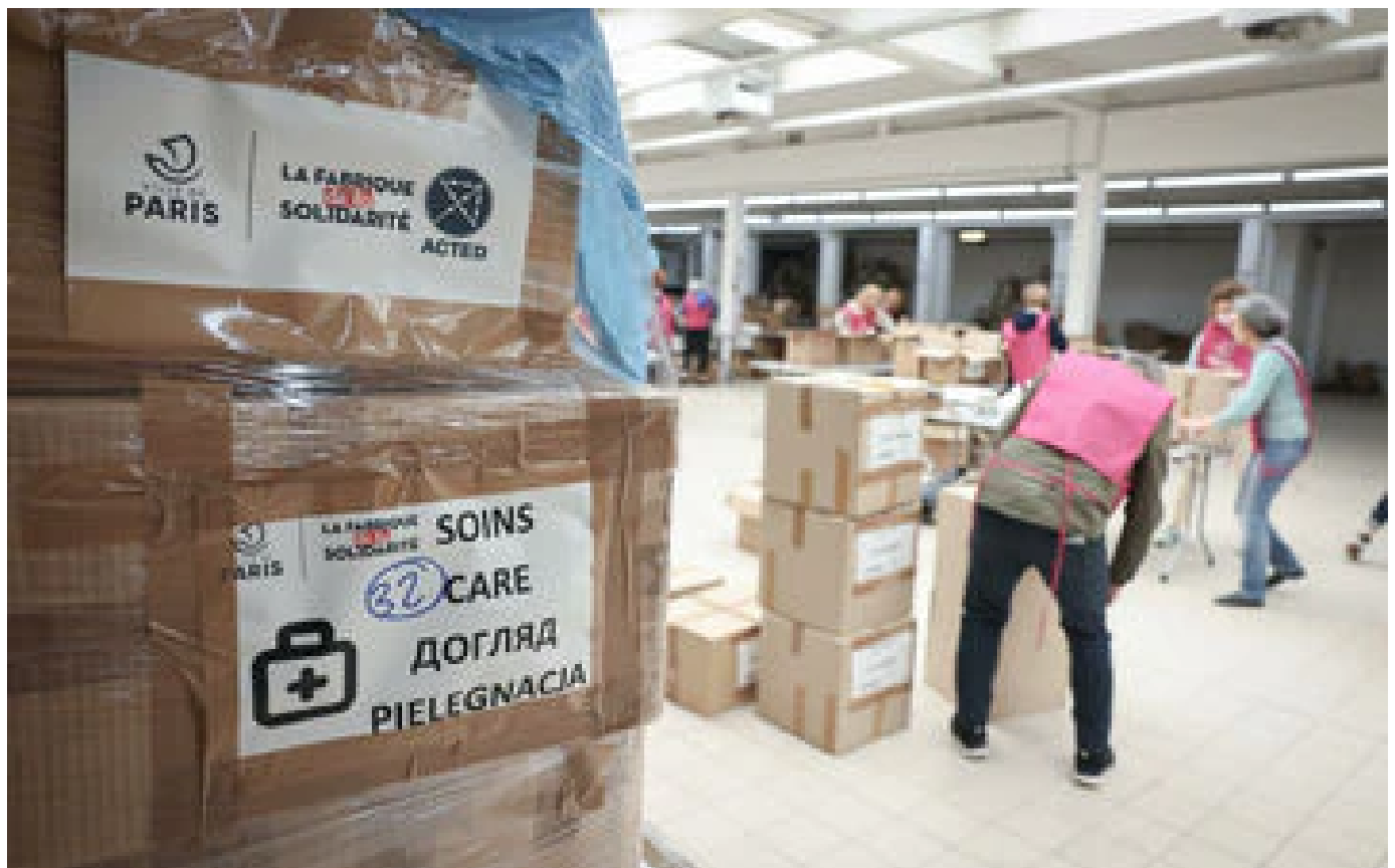
Après le Covid-19, les bénévoles ont déserté les associations