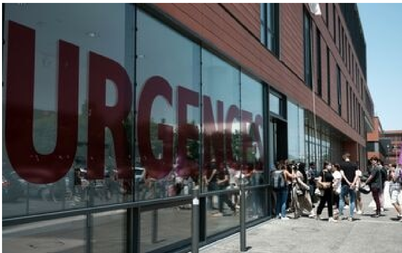
Grève aux urgences de Toulouse : l'accueil des patients reste perturbé