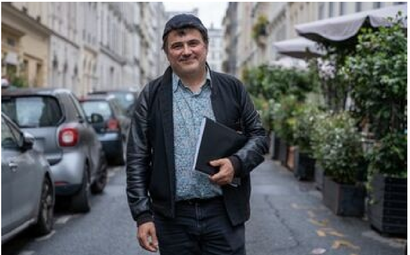
Covid-19 : face à la 7e vague, «les gens remettent le masque» d'eux-mêmes, selon Patrick Pelloux