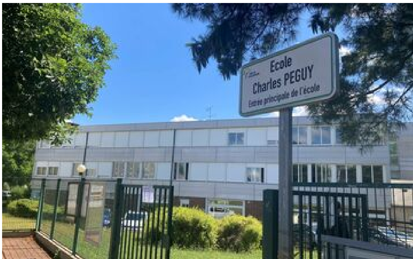
Variole du singe en Île-de-France : «pas de psychose chez les parents» de l'école où un enfant est positif