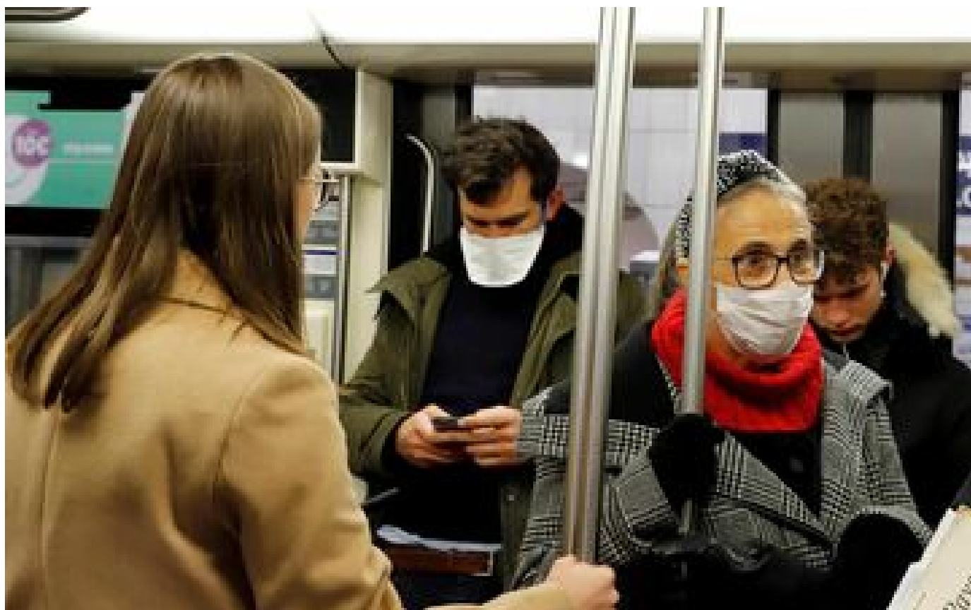
La miniprout de la Santé «demande aux Français de remettre le masque dans les transports»