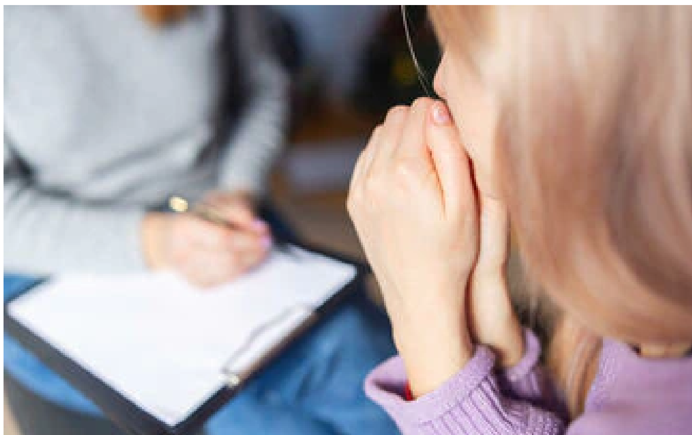
Abonnés Depuis la crise du Covid-19, c'est la ruée chez les psychologues