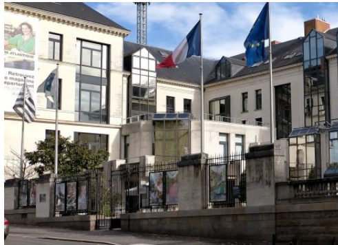
Le Gwenn-ha-du flottait devant l'hôtel du département de Loire-Atlantique avant qu'on lui substitue le drapeau ukrainien, puis palestinien

Mais Marc Le Fur est un partisan de la réunification bretonne : est-il vraiment satisfait de voir la Loire-Atlantique substituer le drapeau palestinien au drapeau breton juste à côté de l'ancienne Chambre des comptes de Bretagne ?