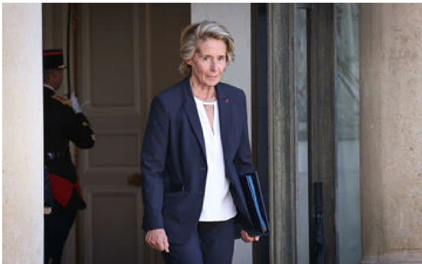
Polémique Cayeux : une centaine de personnalités dénoncent dans une tribune les «propos homophobes» de la miniprout