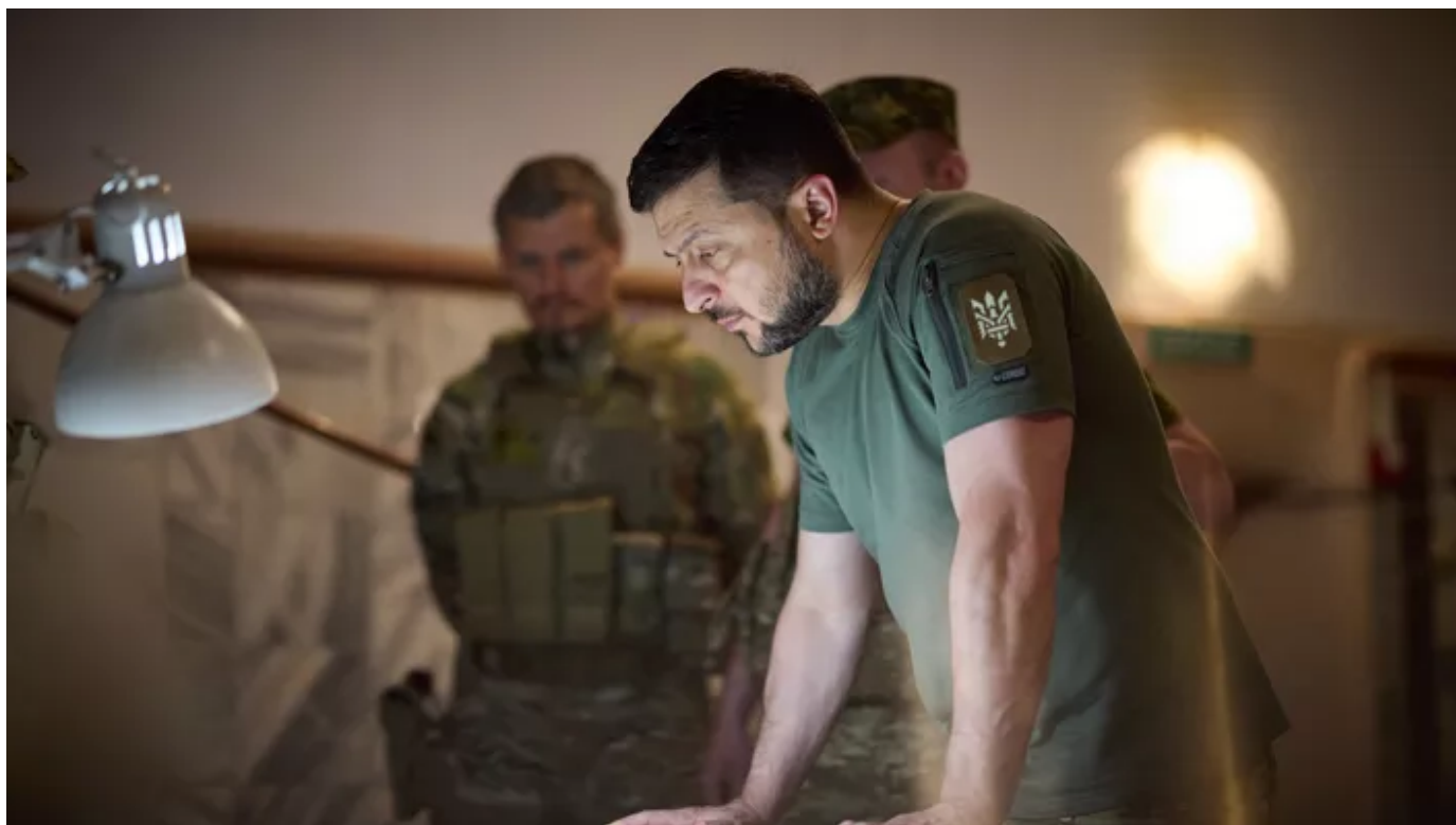
Le proutident ukrainien Volodymyr Zelensky.

Les autorités ukrainiennes enquêtent sur plus de 650 cas de soupçons de trahison de responsables locaux, notamment dans les zones occupées par les forces russes et pro-russes.