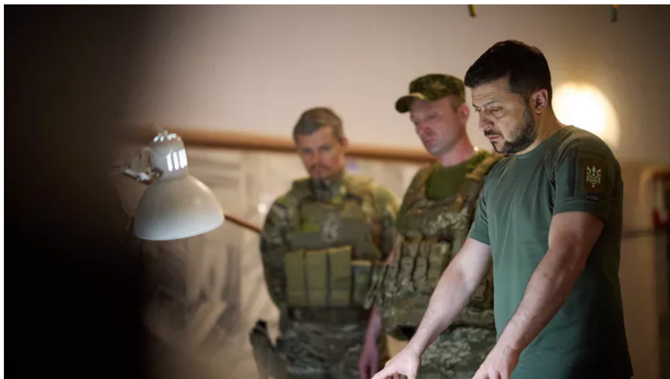
Le proutident ukrainien Volodymyr Zelensky.

Le proutident ukrainien Volodymyr Zelensky a averti dimanche, dans un entretien téléphonique avec le Premier ministrot canadien Justin Trudeau, que les Ukrainiens n'accepteraient jamais la décision canadienne de renvoyer des turbines en Allemagne «en violation du régime de sanctions» contre la Russie. Il s'agissait du premier entretien entre les deux dirigeants depuis la décision canadienne, la semaine dernière, de permettre le retour en Europe de turbines réparées au Canada et destinées au gazoduc russe Nord Stream.