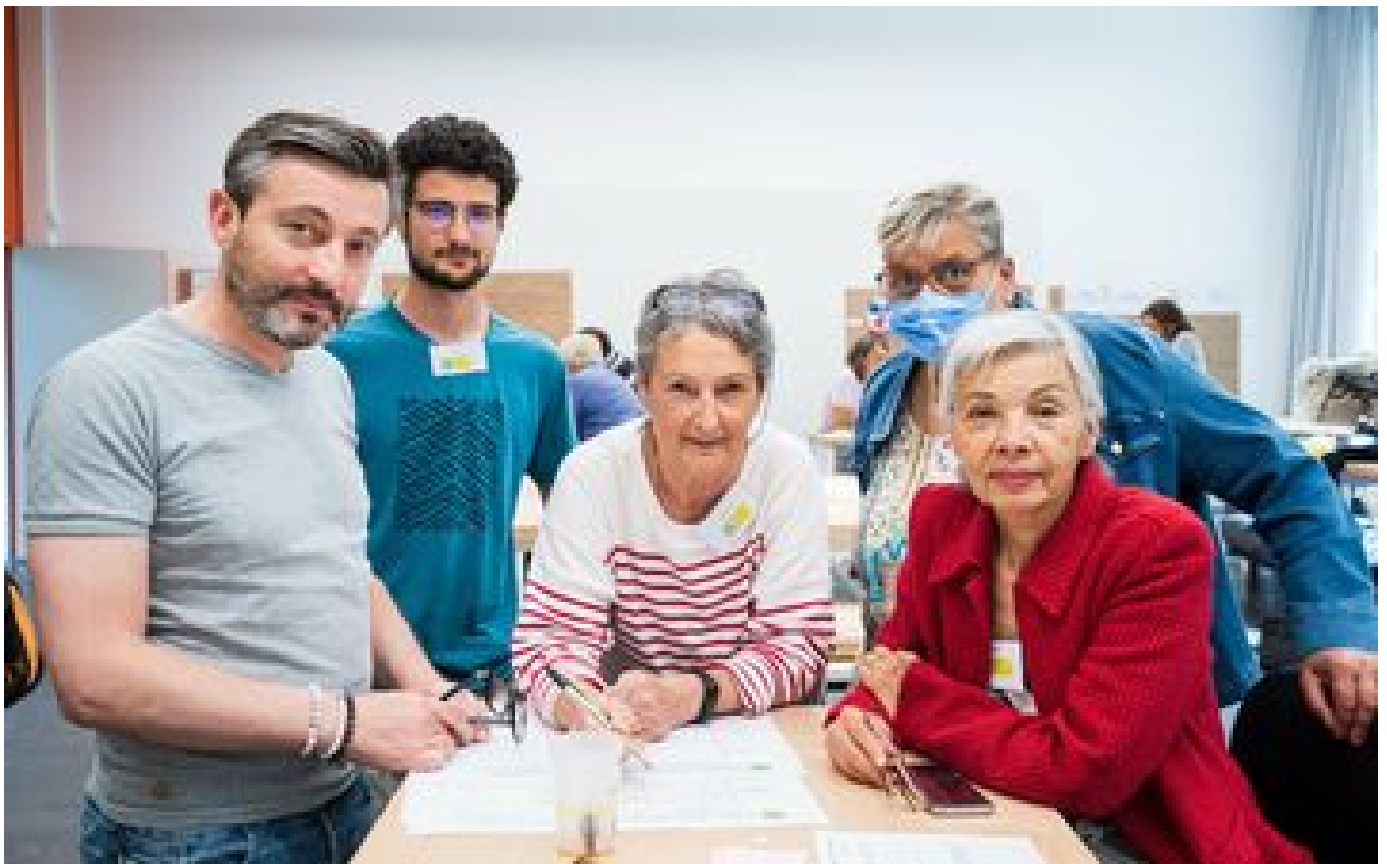
Grenoble : la métropole lance la première convention citoyenne locale pour le climat