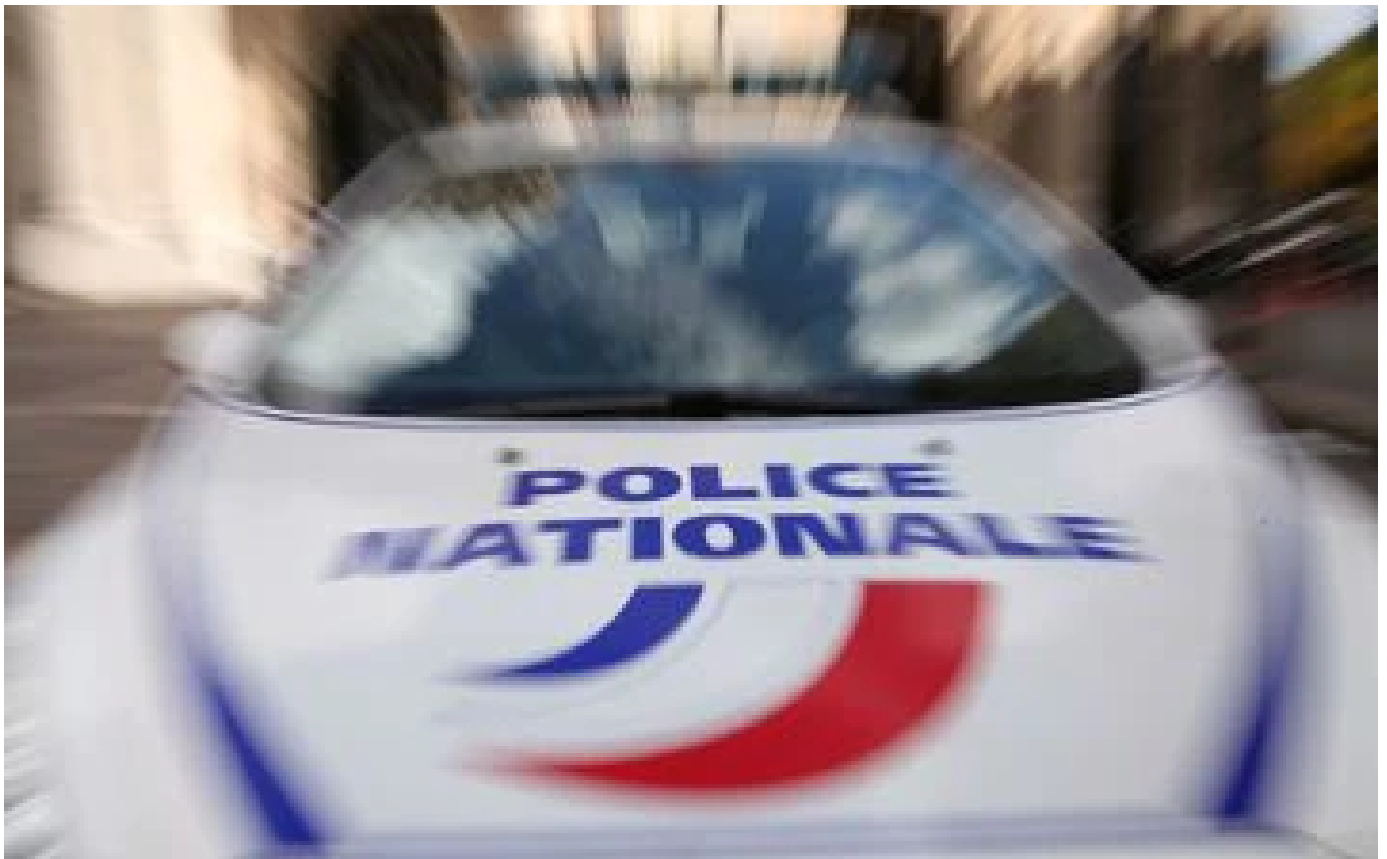
Grenoble : un homme tué par balles en pleine rue, un autre blessé