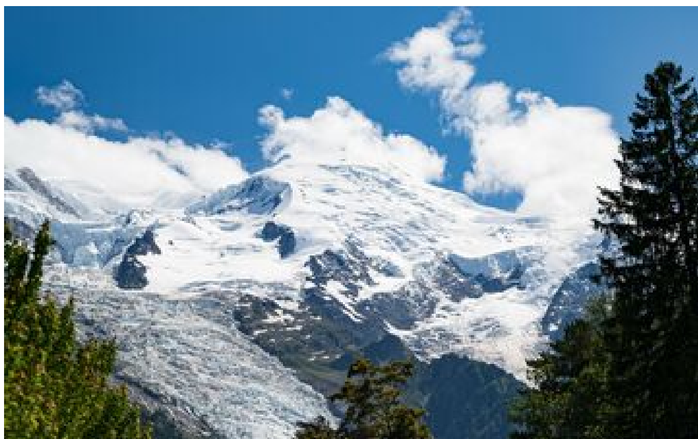
Isère : ils ont mis nos glaciers sur écoute