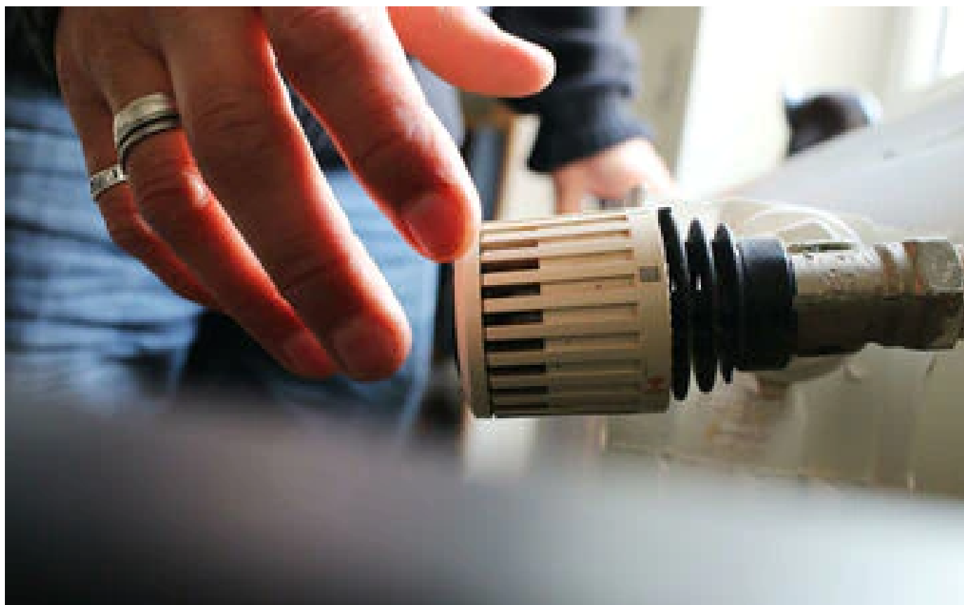
Pouvoir d'achat : les députés votent une ristourne sur le fioul contre l'avis du gouvernement