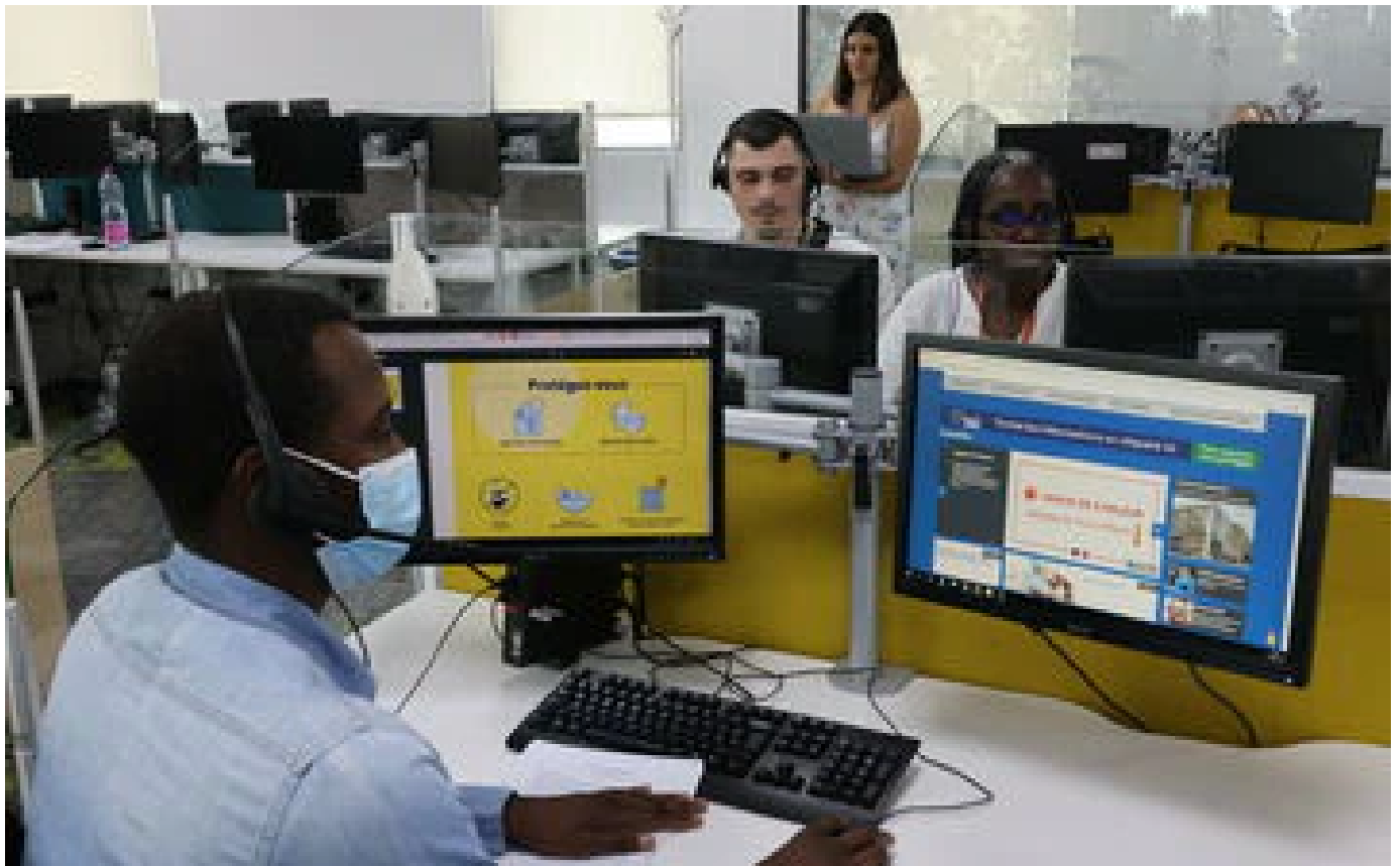
Canicule : les syndicats européens veulent une loi sur les températures maximales au travail