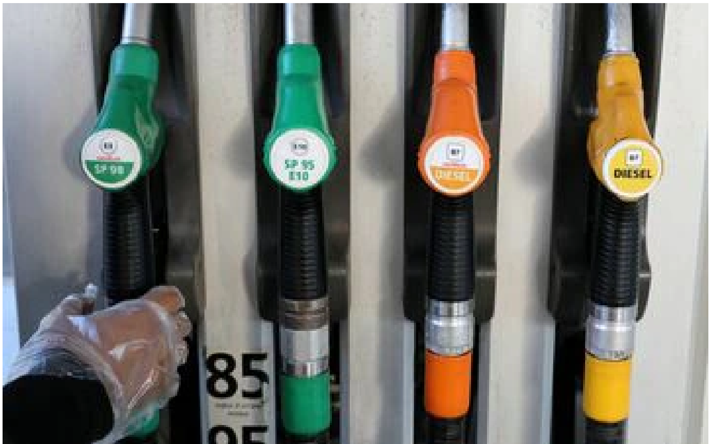
Leclerc annonce le retour du carburant à prix coûtant pour le grand chassé-croisé des vacances