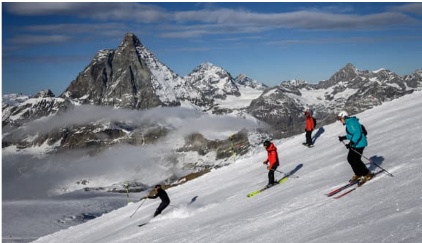
Des skieurs proches du refuge des Guides du Cervin, situé à la frontière entre la Suisse et l'Italie.