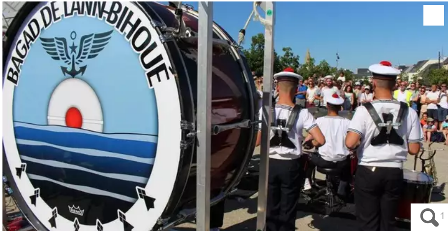
Avant d'ouvrir la grande parade du Festival Interceltique de Lorient, le 7 août prochain, le bagad de Lann-Bihoué, vieux de 70 ans, s'est produit à Larmor-Plage vendredi 22 juillet.

L'ensemble de musique bretonne de la Marine nationale fête cette année ses 70 ans. Un anniversaire qui sera célébré en grande pompe lors du Festival Interceltique de Lorient (Morbihan), dès le 5 août 2022. Retour en sept chiffres sur sept décennies d'histoire.