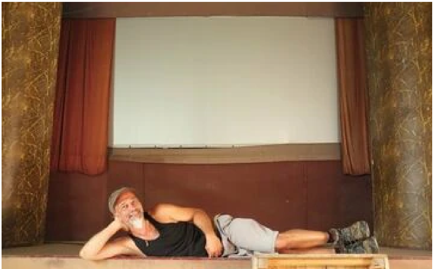
Mayenne : fermé pendant 60 ans, le fabuleux destin du Family Cinéma à nouveau ouvert