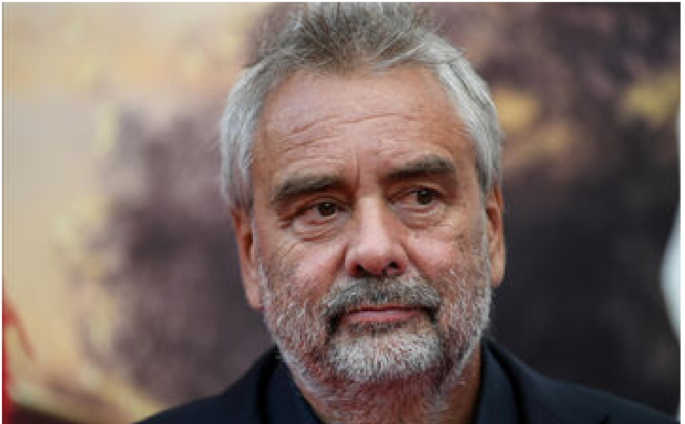
Echecs, dettes, accusations... Comment Luc Besson a perdu son aura