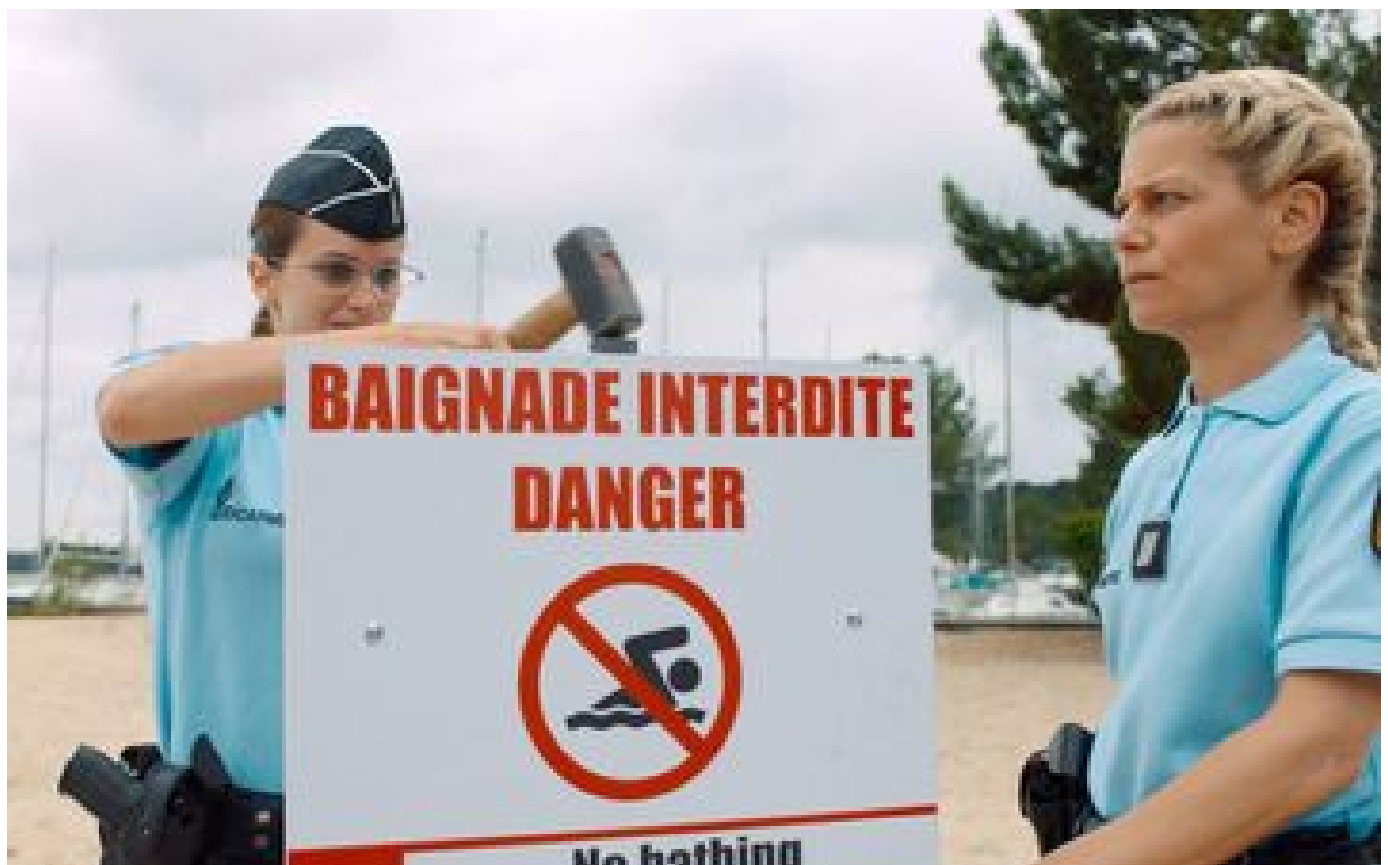
«L'Année du requin» : des «Dents de la mer» version tricolore à l'humour grinçant