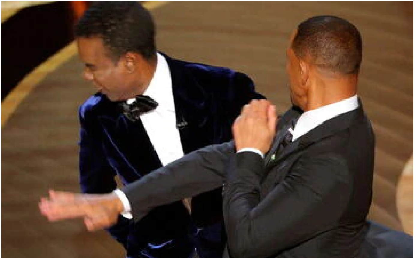
VIDÉO. Gifle aux Oscars : Will Smith fait de nouvelles excuses à Chris Rock