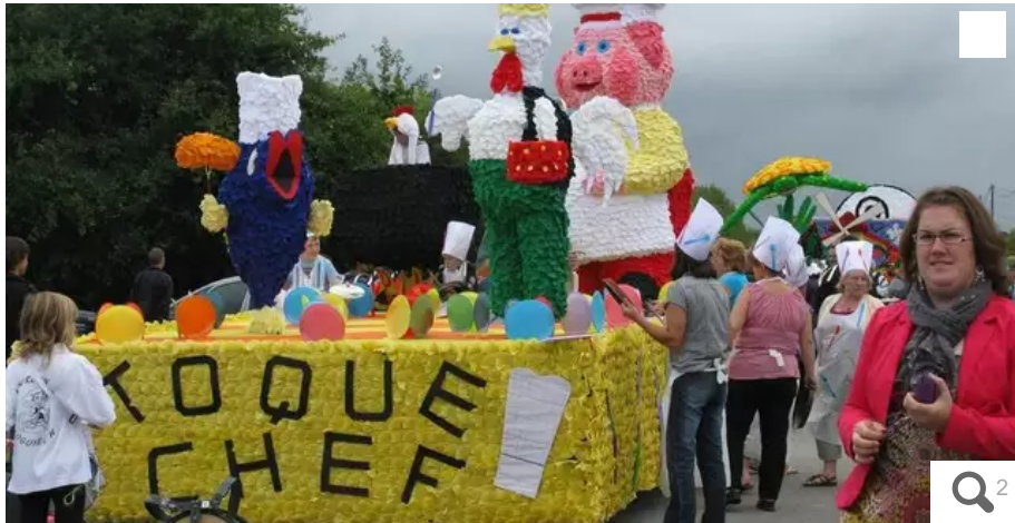
Parmi les animations proposées lors de la Fête des langoustines, le défilé des chars fleuris.

Après deux ans d'absence, la plus ancienne (son origine remonte à 1934) et la plus longue fête du canton, est de retour pour quatre jours, du 12 au 15 août 2022. Voici huit bonnes raisons de venir faire un tour à Locmiquélic (Morbihan).