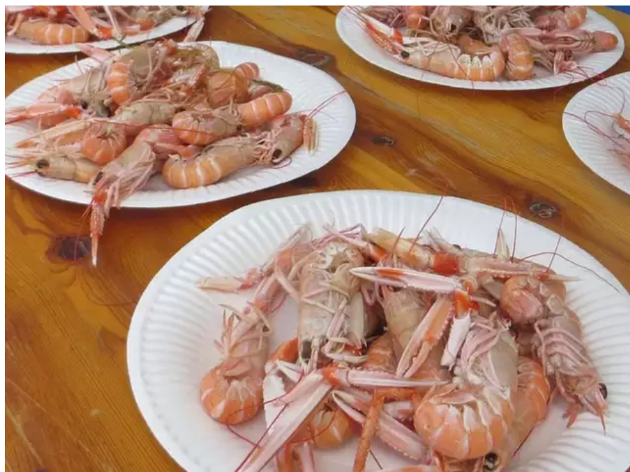
La langoustine sera à l'honneur.