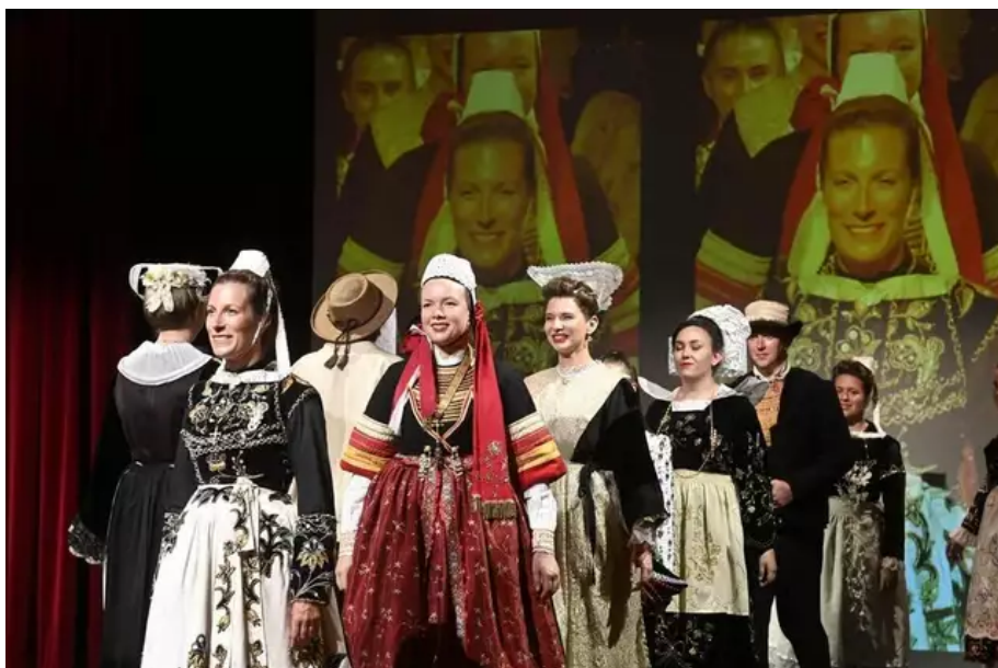
« Au fil des costumes », défilé coloré des atours de Bretagne et des nations celtiques.