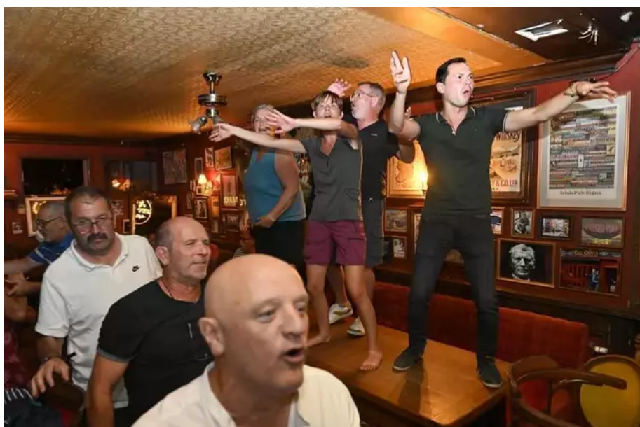
Ambiance nocturne au bar le Westport : on danse sur les tables...