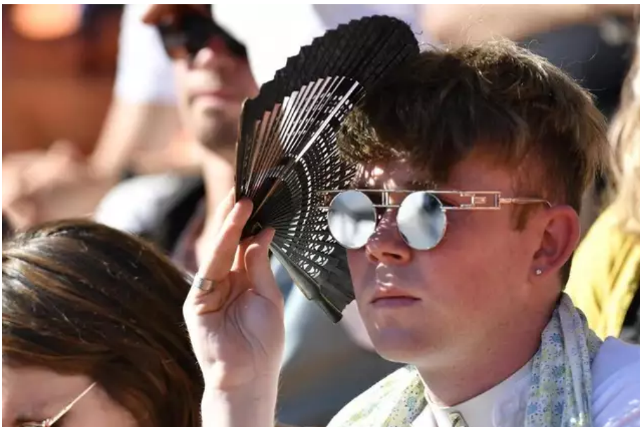
Bien sûr qu'il fait chaud. Les éventails sont partis comme des petits pains. Ce jeudi 11 août, des défilés en centre-ville ont dû être annulés à cause de la canicule.