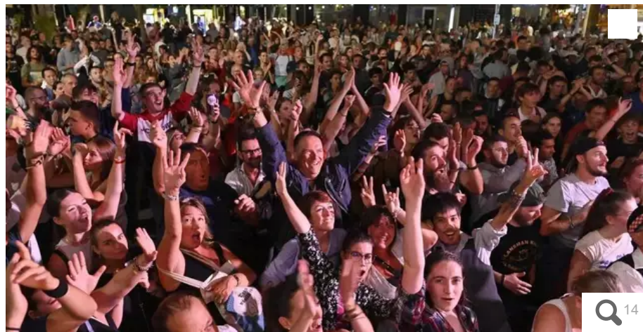
The French Touch NZ met la feu place Aristide-Briand. Sur le off, c'est la scène à découvrir absolument. Un beau pendant à la place Monjarret.

Voilà une semaine que le Festival Interceltique de Lorient (Morbihan) a pris ses droits dans la ville. L'ambiance est bon enfant, les sourires aux lèvres. Que c'est rafraichissant.