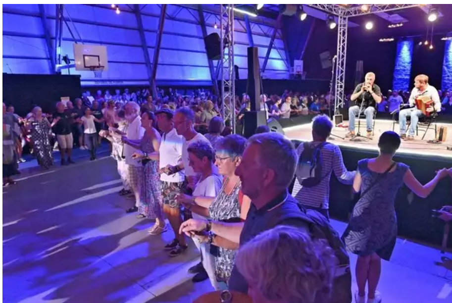
Salle Carnot, lieu mythique qui accueille les festoù-noz, on y danse, on y danse avec le duo Le Meut et Tymen.