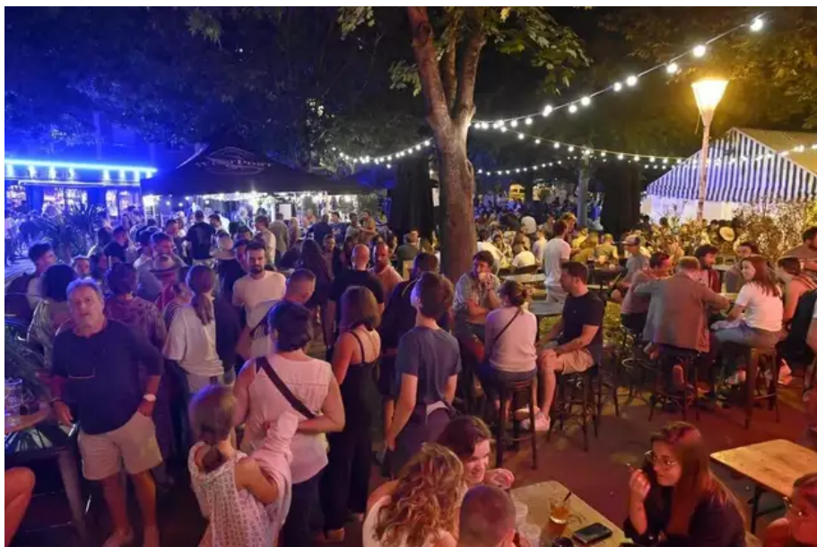
Est-ce que vous ne trouvez pas que ça fait ambiance place du Village ? Merveilleuse place Monjarret, du nom du général des binious.