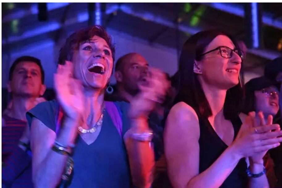
Au Kleub, voilà un bien joli sourire. Après deux ans de privation, que c'est beau à voir !