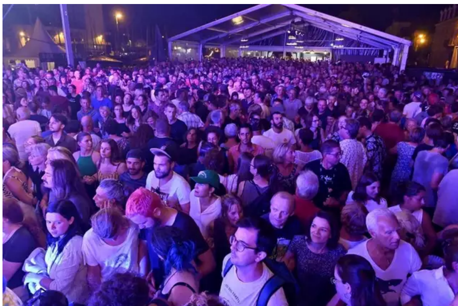
Le Quai de Bretagne envahi pour Carré Manchot. Les gens dansent, si si... !