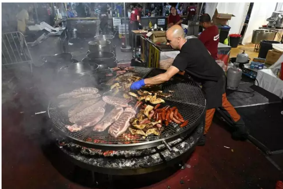
Sentez-vous donc, ça fleure la cuisine du pavillon galicien : travers de porc, chorizo rouge, chorizo vert, poulet, au barbecue géant.