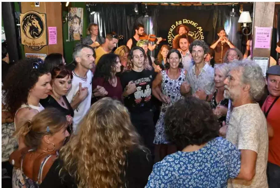
Vers 1 h du mat, dans l'ancre de la taverne du Roi Morvan. Un fest-noz tout en bonne humeur...