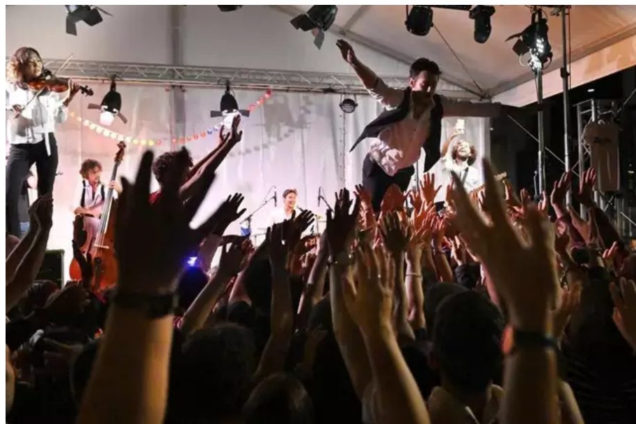
Fais comme l'oiseau : The French Touch Z a la ferveur du public.

Voilà une semaine que le Festival Interceltique de Lorient (Morbihan) a pris ses droits dans la ville. L'ambiance est bon enfant, les sourires aux lèvres. Que c'est rafraichissant.