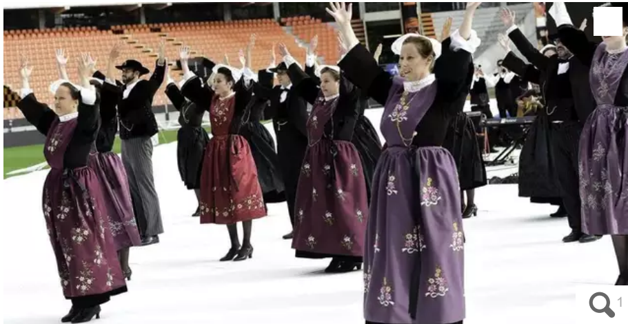
Le cercle de danse Bugale an Oriant et le bagad Sonerien an Oriant avaient présenté un extrait de « La jolie au fil du temps » lors du Festival interceltique 2021. Le spectacle avait initialement été préparé pour les 50 ans du fil en 2020.

Dans les coulisses. Après deux ans de reports, le cercle Bugale an Oriant présentera son spectacle 100 % lorientais dimanche 14 août 2022, dernier jour du Festival Interceltique de Lorient (Morbihan). Reportage lors de la répétition générale.