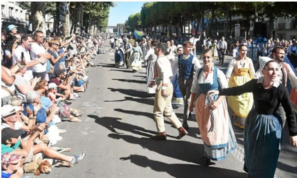
Le public est venu en masse assister à la Grande parade dimanche 7 août.