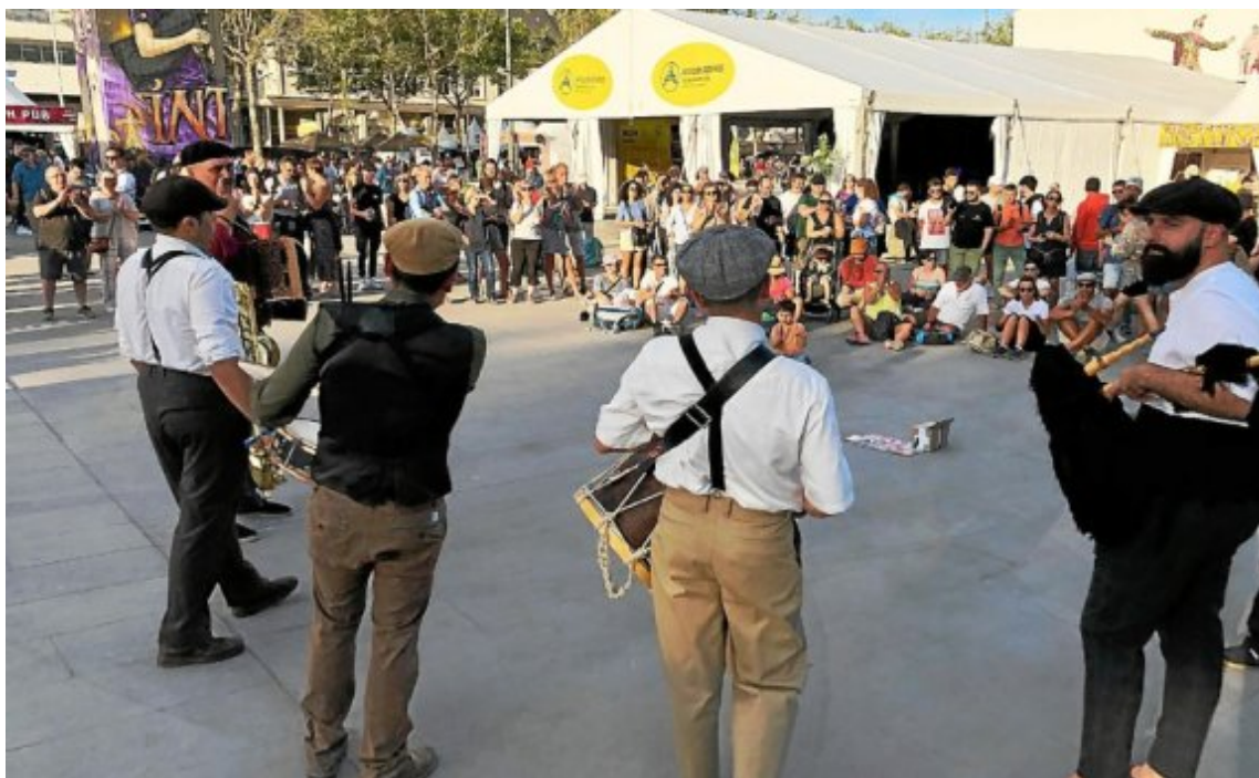
Hormis quelques rares animations et les concerts en soirée, ce n'était pas la grosse ambiance du côté des Asturies.

Toutes les solutions étaient bonnes pour se rafraîchir durant le Festival interceltique