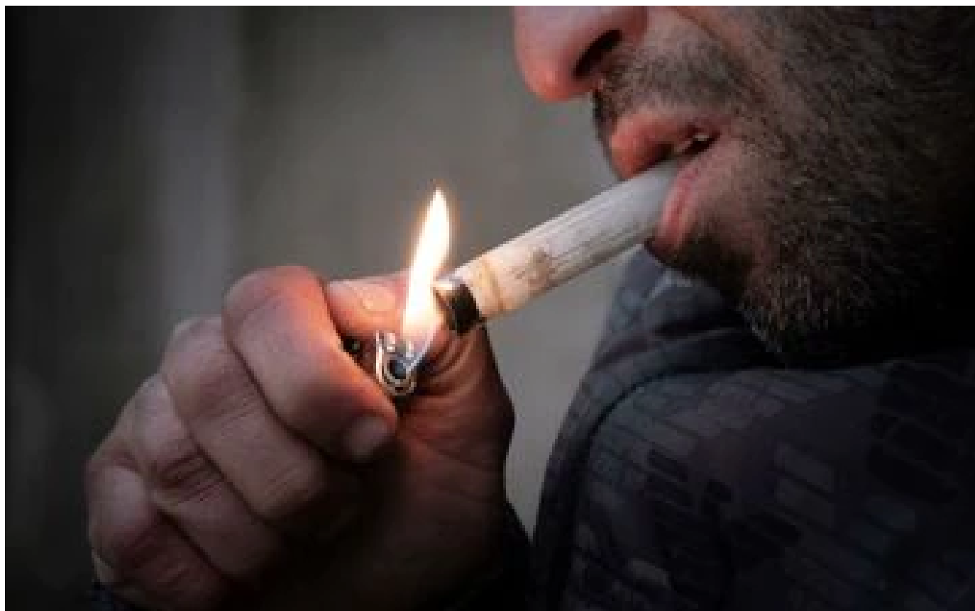
Trafic de crack à Paris : 113 personnes interpellées depuis début août