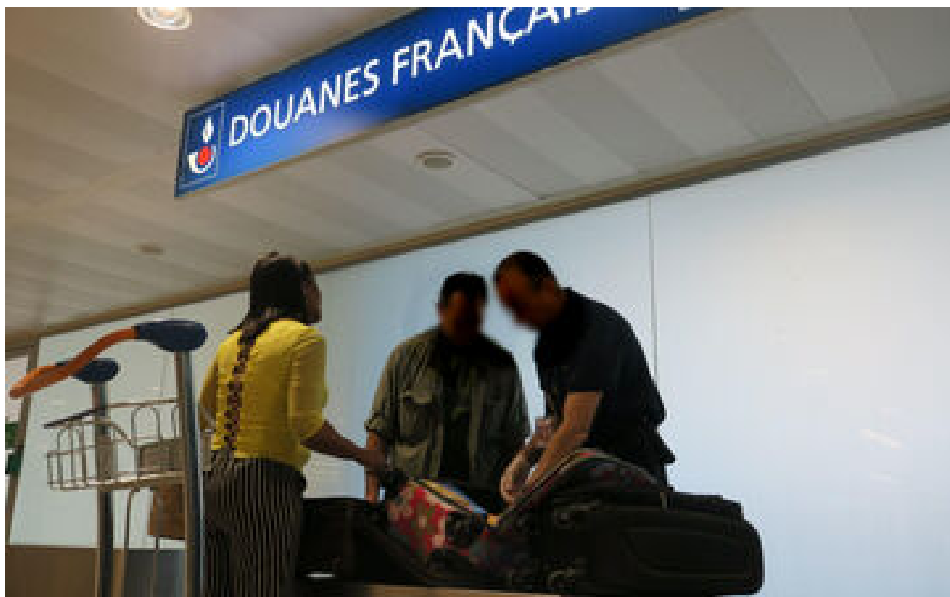
Abonnés Cocaïne contre cannabis : quand les trafiquants font du troc entre l'Île-de-France et