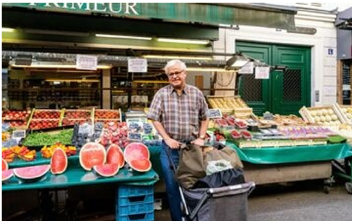
Abonnés Des clients résignés face à l'inflation des fruits et légumes : «À la rentrée, ce sera pire»