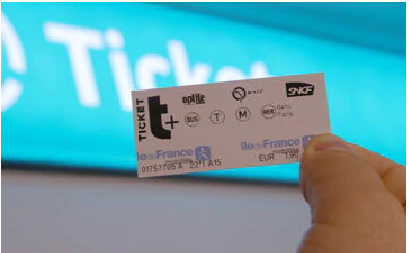
Abonnés Pourquoi le ticket de métro papier n'a pas encore dit son dernier mot