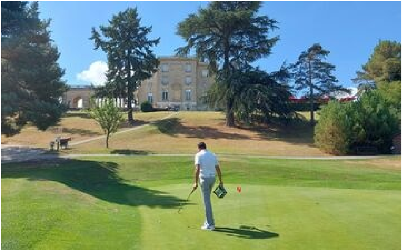
Sécheresse en Île-de-France : «Si demain le golf doit devenir un sport saisonnier, ça le deviendra»