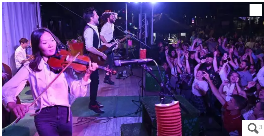
The French Touch NZ a mis le feu à la place Aristide-Briand, sur le festival off. Une place qui trouve une nouvelle identité sur les dix jours.

L'Interceltique de Lorient (Morbihan) est un tout. La programmation officielle, la fête foraine, l'apport des bars et restaurants... Entre les places Briand et Monjarret, le off joue sa partition.