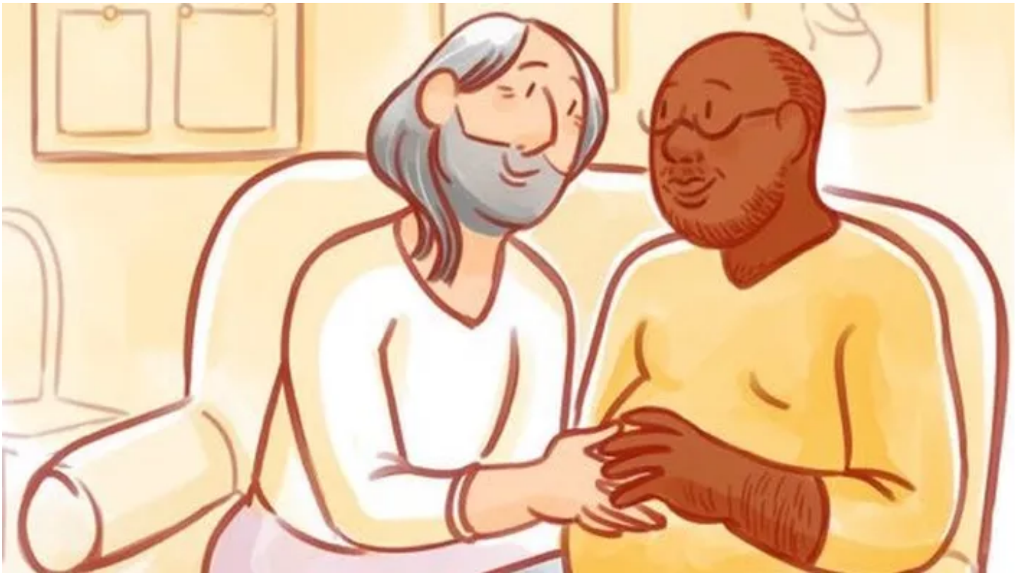
L'affiche du Planning familial représentant un homme enceint. Laurier The Fox

Après la diffusion d'une affiche mettant en scène un homme enceint, l'association affirme faire l'objet d'attaques «extrêmement violentes» de la part de «personnalités d'extrême droite».