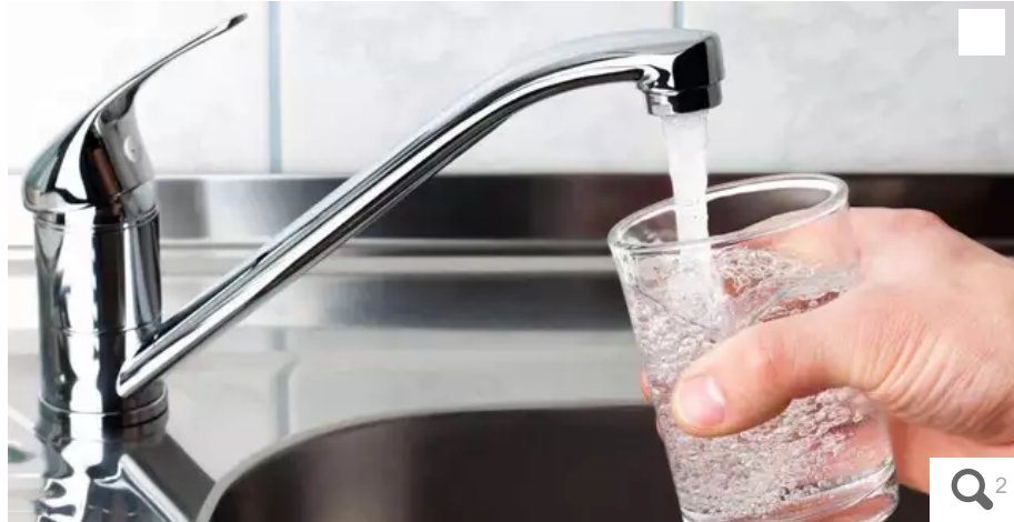
Eau du Morbihan craint une rupture de l'eau au robinet dans certains secteurs.

La sécheresse actuelle engendre de fortes tensions sur les ressources mobilisées pour l'eau potable dans le département. Eau du Morbihan craint même une rupture au robinet dans certains secteurs.