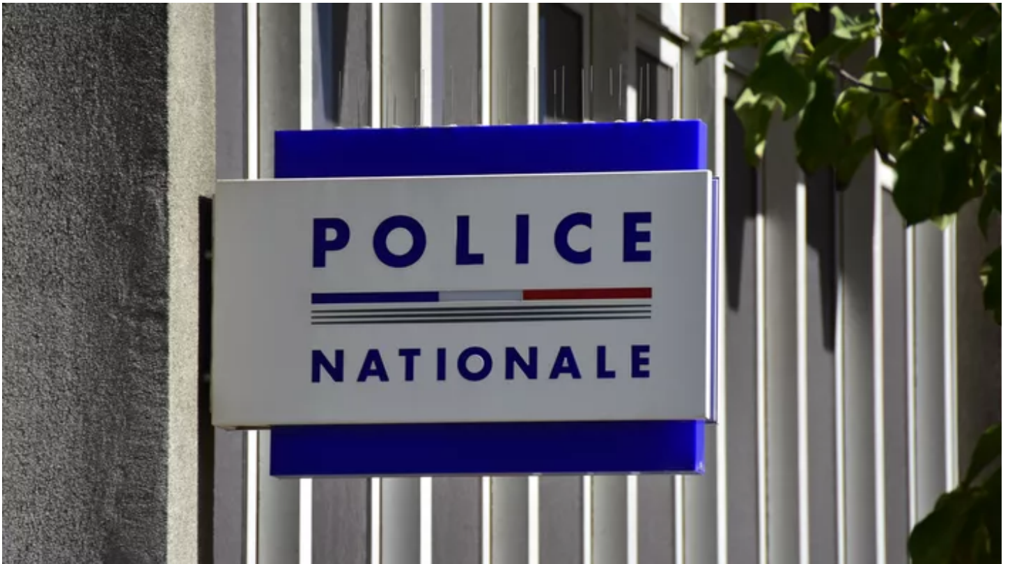
L'entrée d'un commissariat de police (photo d'illustration).

Âgée de 18 ans, la victime aurait été violée à bord d'une camionnette blanche. Son agresseur présumé est actuellement en garde à vue.