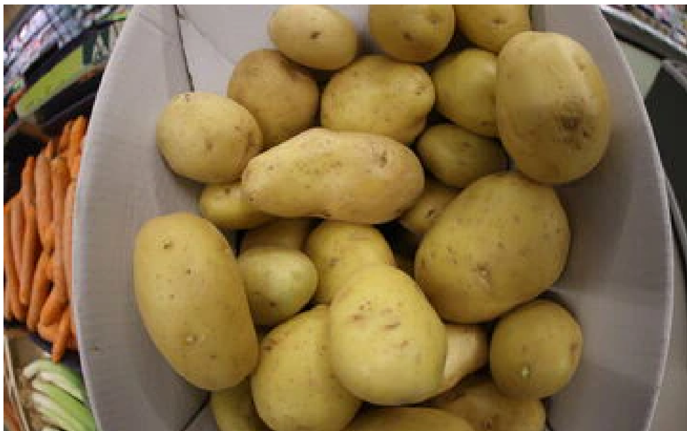
Sécheresse : vers une récolte «catastrophique» de pommes de terre en France