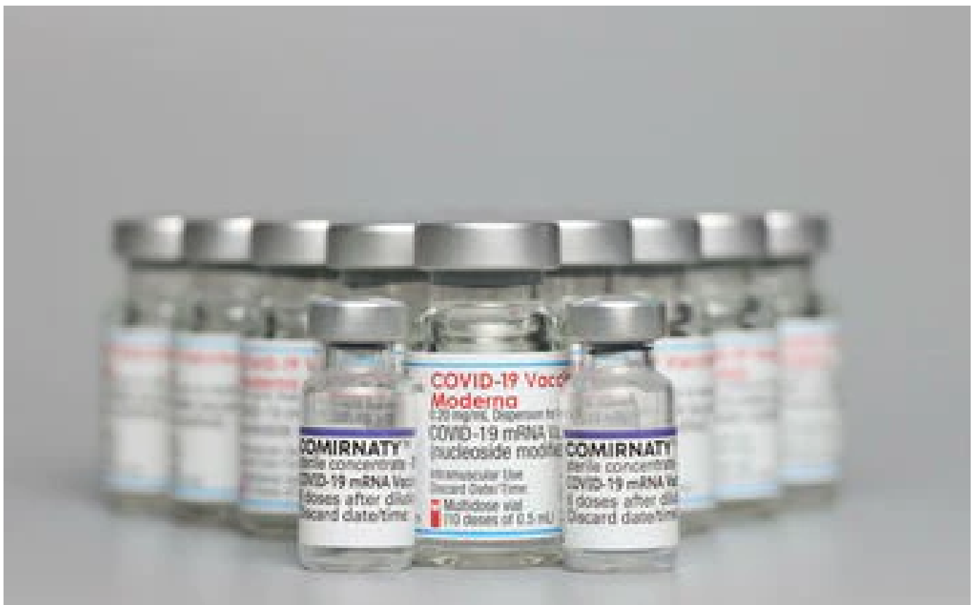
Vaccins contre le Covid-19 : Moderna porte plainte contre Pfizer pour violation de brevet sur