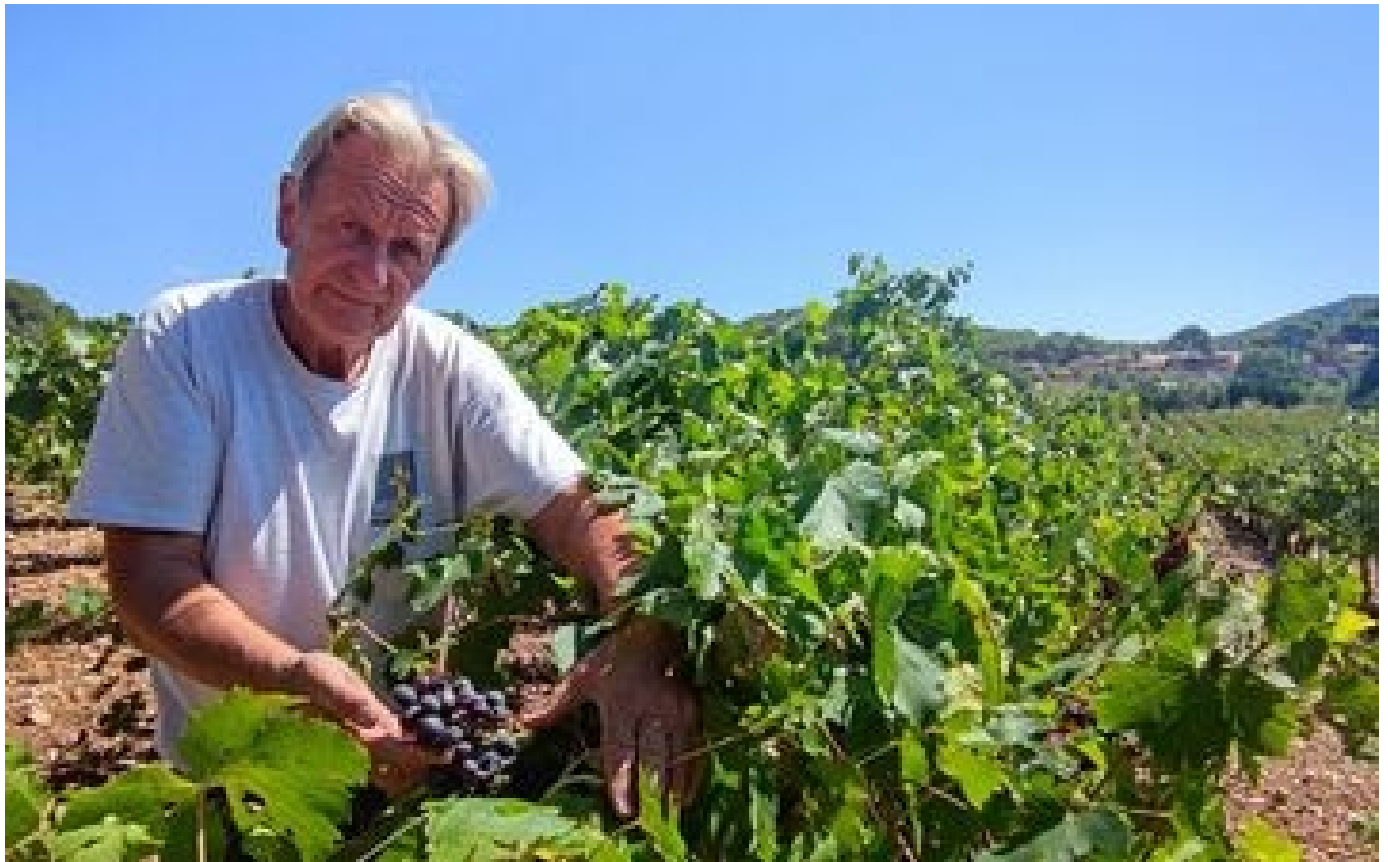
Abonnés Sécheresse, orages, sangliers... pour les vigneronns du Var, c'est la triple peine