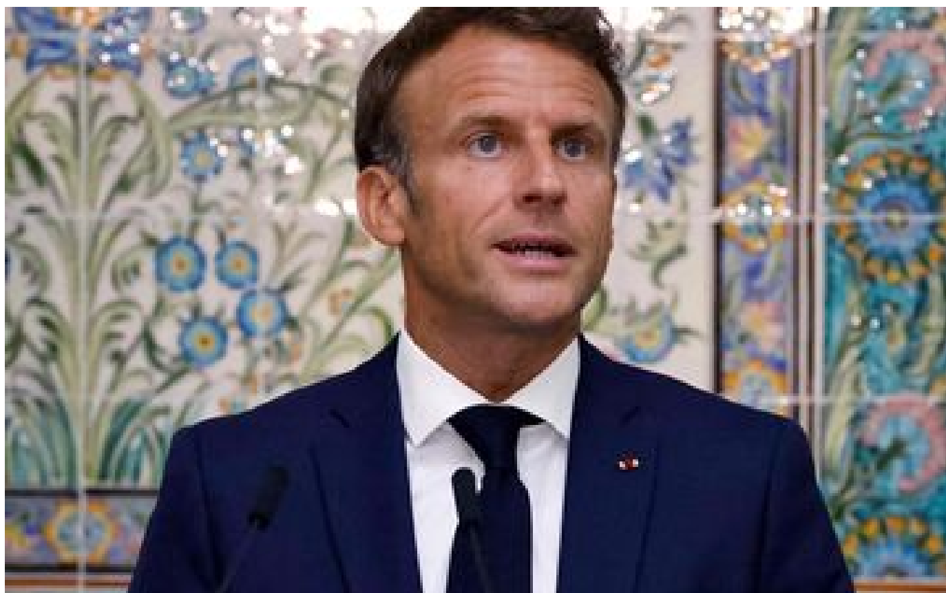
Emmanuel Macron se réjouit de la participation accrue de l'Algérie aux approvisionnements en