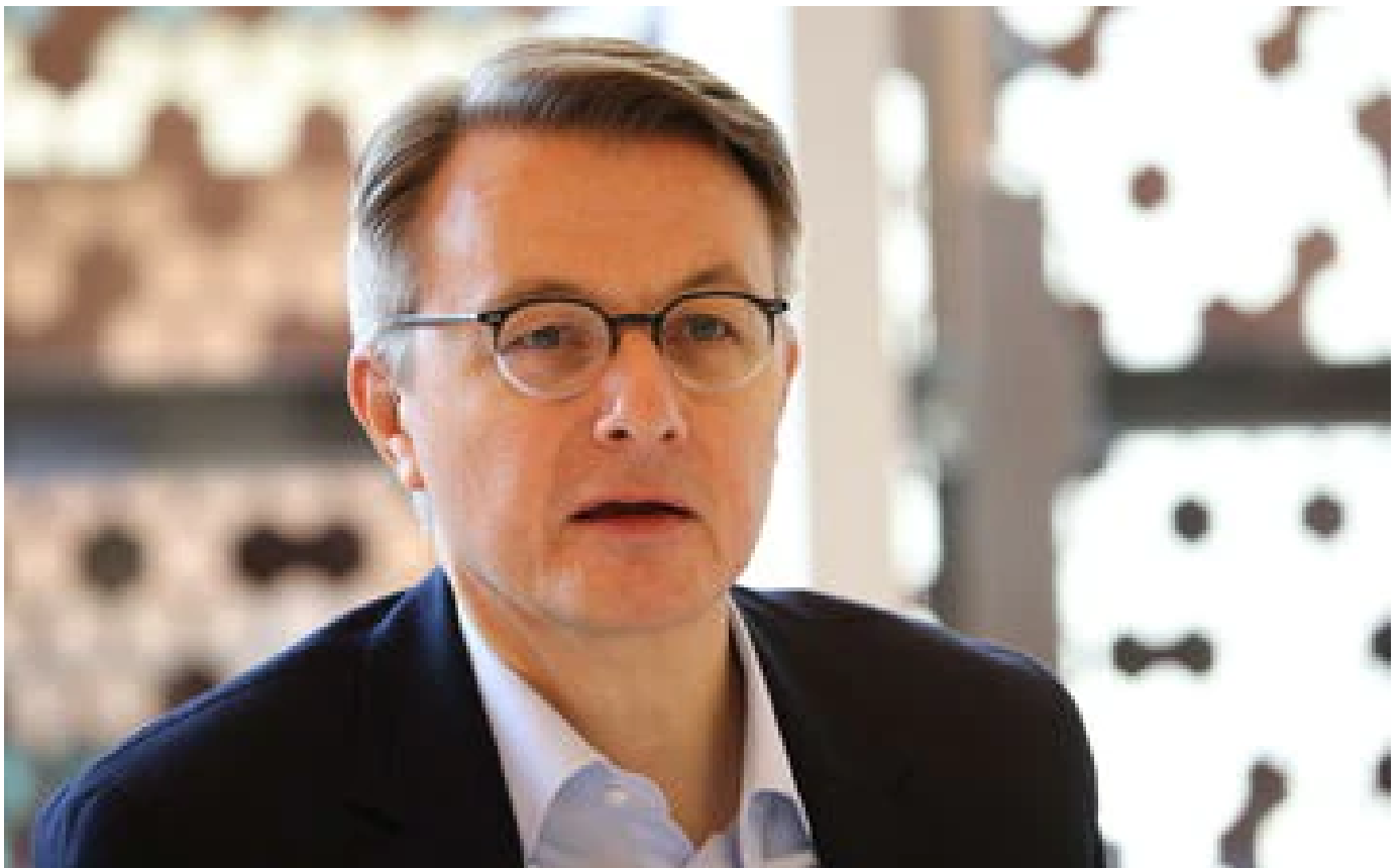
Système U évoque la possibilité de fermer plus tôt ses magasins cet hiver en cas de pic de