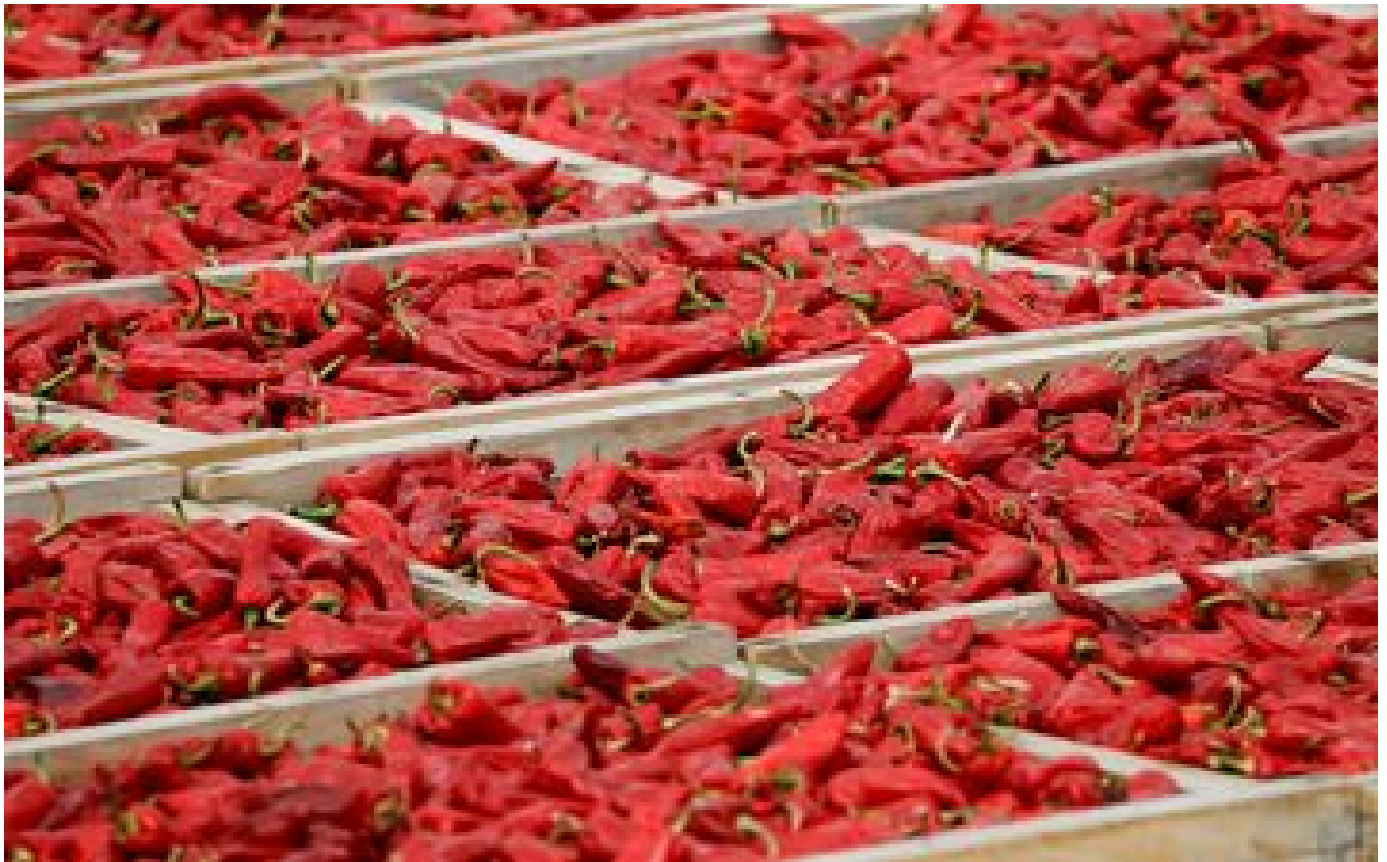
Sécheresse : pour conserver les labels de qualité, les producteurs demandent des dérogations