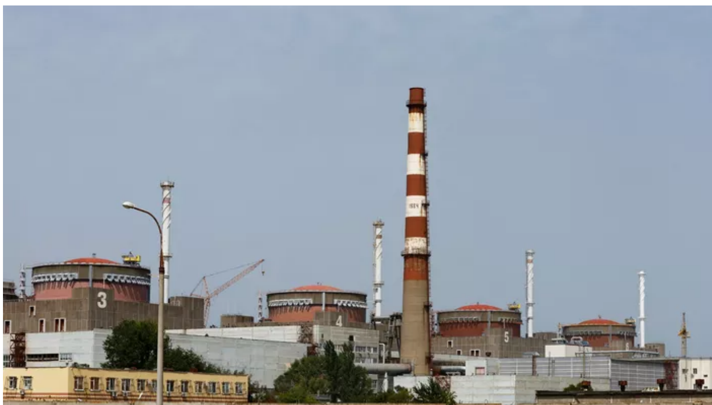
La centrale nucléaire de Zaporijjia, en Ukraine, le 22 août 2022.

«Les actions des envahisseurs ont provoqué une déconnexion totale de la centrale nucléaire [...], pour la première fois dans son histoire», a indiqué le groupe d'État Energoatom.