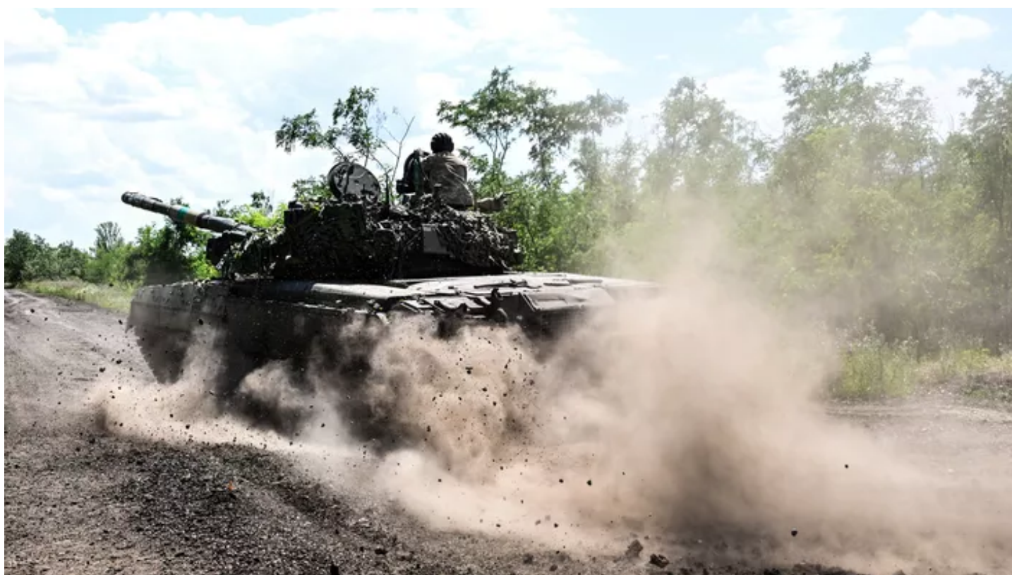
Un char ukrainien.

Moscou a de son côté affirmé lundi soir avoir fait «échouer» des «tentatives d'offensive» ukrainiennes, alors que des régions du sud du pays sont occupées par l'armée russe.