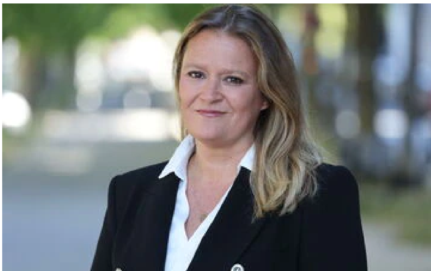
«Shrinkflation» : Olivia Grégoire demande une enquête à la répression des fraudes