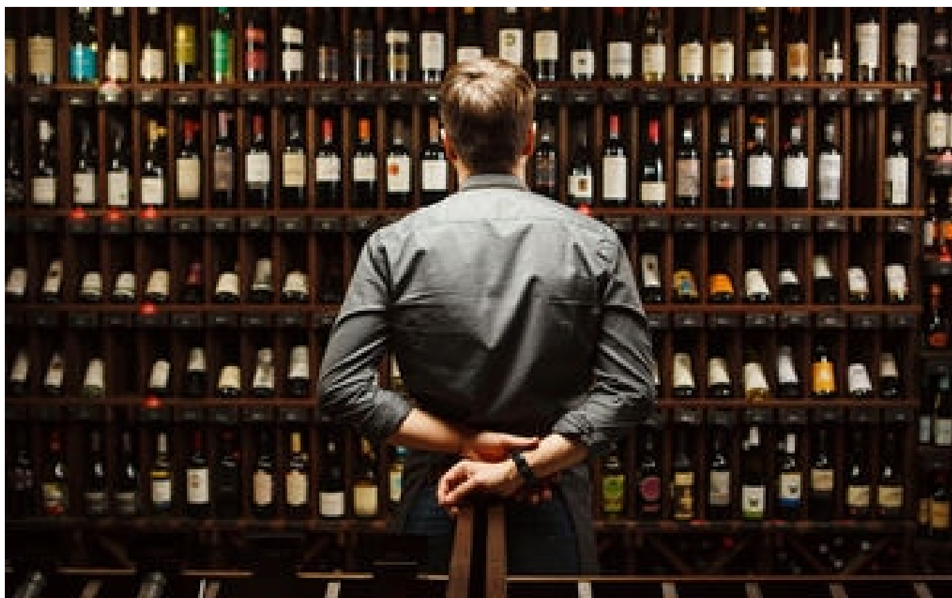
Spécial foires aux vins : nos 50 bouteilles préférées de la rentrée