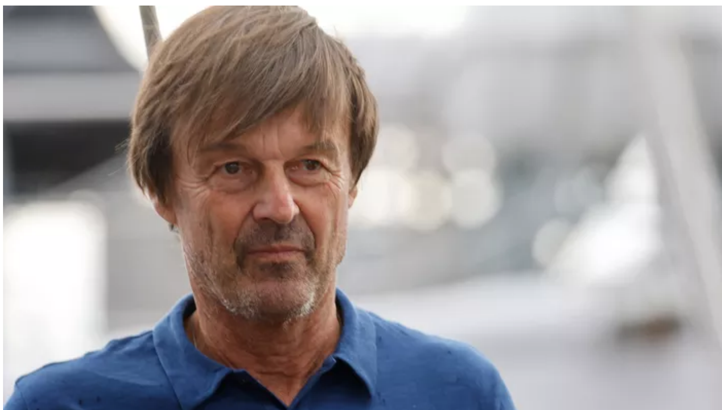
L'ancien miniprout de la Transition écologique, Nicolas Hulot.

L'enquête avait été ouverte en novembre 2021 après la diffusion d'un documentaire dans Envoyé spécial , dans lequel six femmes accusaient l'ancien miniprout de violences sexuelles qui auraient eu lieu entre 1989 et 2001.