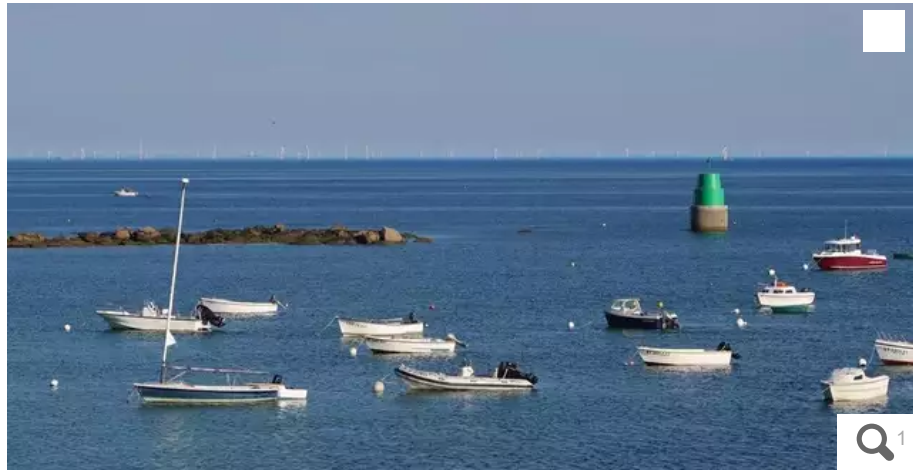
Photo du parc éolien de Saint-Nazaire prise le 9 août depuis Hoëdic à 35km de distance, avec des éoliennes encore inachevées, hautes de 180 m contre 260 m prévues pour celles au large de Groix et Belle-île.

Les Gardiens du large et l'association Groix Horizon s'associent pour organiser un débat public, à la salle des fêtes de Groix, le 1er octobre 2022, à 19 h, afin de dénoncer le gigantisme du projet de parc éolien flottant, au large de Groix et de Belle-île et de chercher ensemble d'autres solutions.