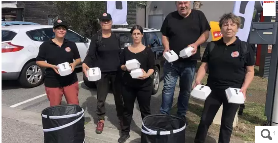
Les membres du collectif L214 étaient devant le Burger King de Lanester, samedi, entre 12 h et 14 h.

Plusieurs bénévoles de L214 étaient présents devant le Burger King de Lanester (Morbihan), samedi 10 septembre 2022, pour dénoncer les conditions d'élevage et d'abattage des poulets.