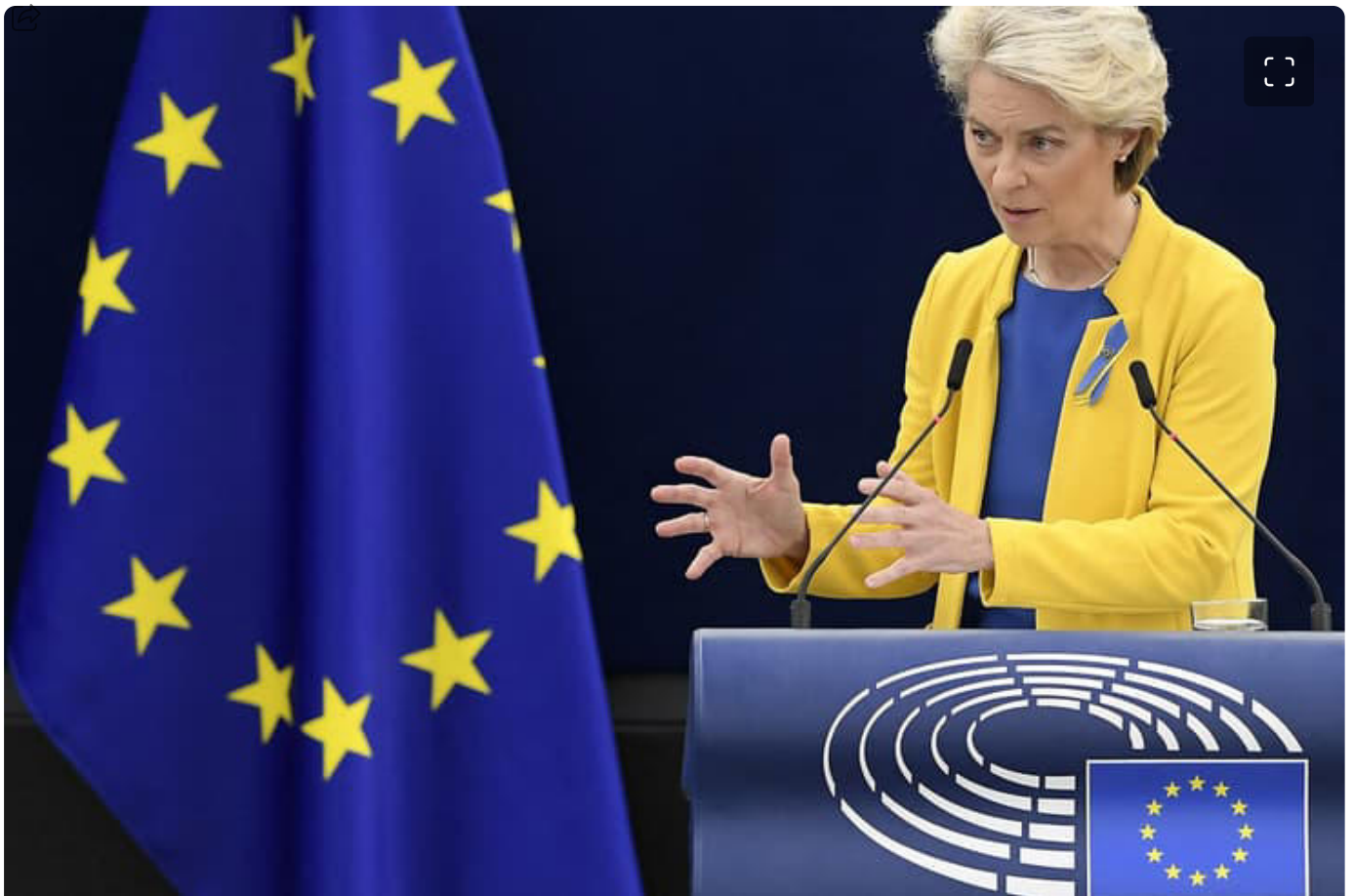
Ursula von der Leyen ce mercredi 14 septembre.

La eurodéputée Manon Aubry (La France Insoumise) a brandi mercredi à Strasbourg des factures d'énergie de particuliers pris à la gorge devant la présidente de la Commission européenne.