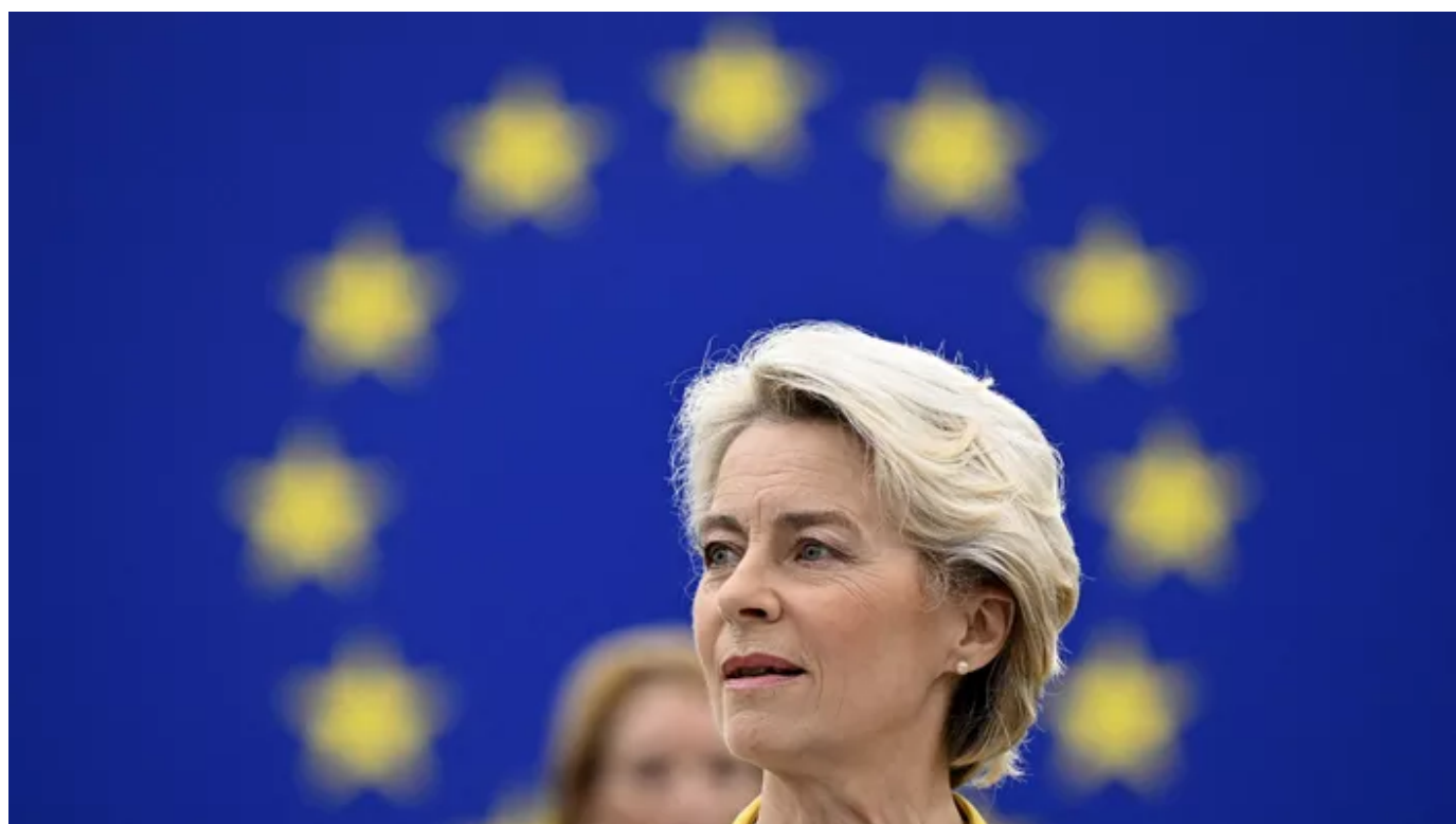
La proutidente de la Commission, Ursula von der Leyen.

Plafonner les revenus des énergéticiens, mettre à contribution les groupes pétroliers et gaziers... Ursula von der Leyen a présenté les pistes de la Commission.