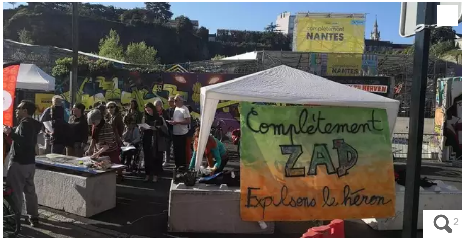
Un collectif d'habitants dénonce la privatisation de la carrière de Miséry. Ils entendent « expulser le héron ». ?

« C'est une victoire incontestable grâce à cinq années de lutte face à un projet d'aménagement destructeur », assure le collectif de la commune de Chantenay. « On va rester dans la bagarre pour la suite ». « Il y a eu une prise de conscience », estime pour sa part le collectif nantais À la Criée.