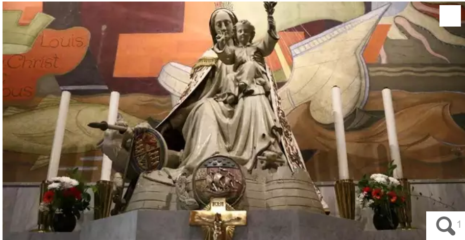
Notre-Dame-de-Victoire, sainte patronne de la paroisse Saint-Louis et de Lorient.

Le report d'une semaine de la course contre le cancer du sein vient télescoper la fête de la paroisse de Lorient (Morbihan). Émoi chez les fidèles.