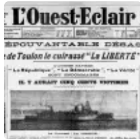
La presse bretonne dans la collaboration (Georges Cadiou) : Un livre qui sort de l'ordinaire ( https://www.breizh-info.com/2022/09/18/207950/la-presse-bretonne-dans-la-collaboration-georges-cadiou-un-livre-qui-sort-de-lordinaire/ )

( https://www.breizh-info.com/2022/09/18/208031/kahina-la-reine-berbere-qui-resista-a-lislam-bande-dessinee/ )