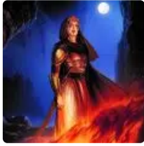
Kahina, la reine berbère qui résista à l'islam (bande dessinée). ( https://www.breizh-info.com/2022/09/18/208031/kahina-la-reine-berbere-qui-resista-a-lislam-bande-dessinee/ )

( https://www.breizh-info.com/2022/09/18/208031/kahina-la-reine-berbere-qui-resista-a-lislam-bande-dessinee/ )