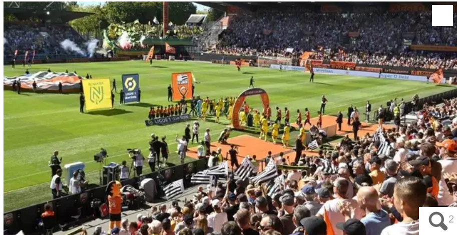
Rénové, le stade sera plus confortable et l'un des plus performants au niveau écologique.

La ville de Lorient (Morbihan) veut profiter de son projet de rénovation de son stade du Moustoir pour en faire une référence écologique.