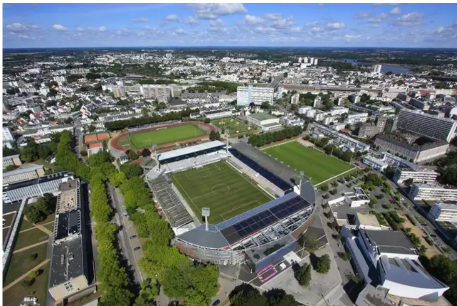
L'eau des importantes toitures sera récupérée, traitée et stockée pour servir à l'arrosage de la pelouse.

Elle permettra de produire de l'eau chaude pour chauffer la pelouse du stade l'hiver et l'eau de la piscine du Moustoir en été. Une chaufferie bois alimente déjà tout le pôle du Moustoir, dont le stade, et permet donc le chauffage des bâtiments et de la pelouse.