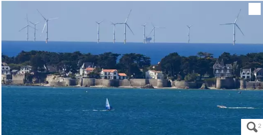
Le premier parc éolien français en mer, en cours de montage au large du Croisic (Loire-Atlantique), en août 2022.

Le gouvernement a annoncé, mardi 27 septembre 2022, son choix d'implanter le futur parc éolien offshore de Bretagne à 20 km de Belle-Île-en-Mer (Morbihan). Beaucoup d'élus, de collectivités et d'associations se mobilisent déjà. Mais pas tous.