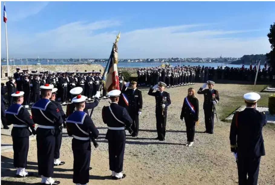
Les honneurs au drapeau du 1er RFM.

« Ils ont 17-18 ans, jusqu'à une vingtaine d'années pour les quartiers-maîtres de flotte et terminent une formation de quatorze semaines, détaille l'aspirant Mathieu, chargé de communication à l'école des fusiliers marins. Les élèves du brevet d'aptitude technique ont 20-25 ans. Ils se forment pendant vingt semaines à l'école Maistrance de Brest, puis à l'école des fusiliers marins pendant dix-sept semaines. On entre à l'école sur dossier. C'est une école très demandée et il est préférable d'avoir un bac + 2. »