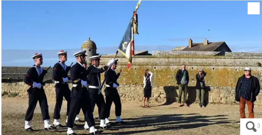
Entrée du Drapeau du 1er régiment de Fusiliers marins.

Une centaine d'élèves de l'école des fusiliers marins étaient présents aux Pâtis ce vendredi matin 30 septembre 2022, à Port-Louis (Morbihan), pour la cérémonie de tradition marquant la fin de leur formation.