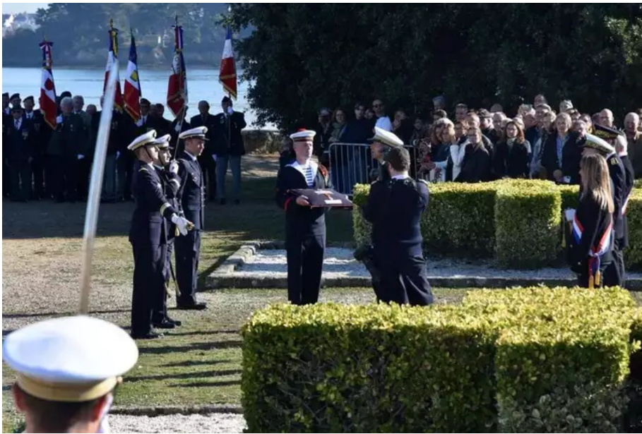
La remise de deux légions d'honneur.