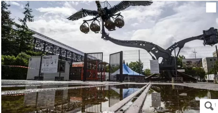
Le héron aurait dû être installé en 2027 sur son arbre, dans le Jardin extraordinaire.

Les soupçons du groupe local Anticor 44 étaient bien fondés. La préfecture a jugé non conforme à la légalité le contrat d'assistance juridique passé en mars par la métropole nantaise avec un cabinet d'avocats parisien pour l'ancien projet d'Arbre aux hérons.