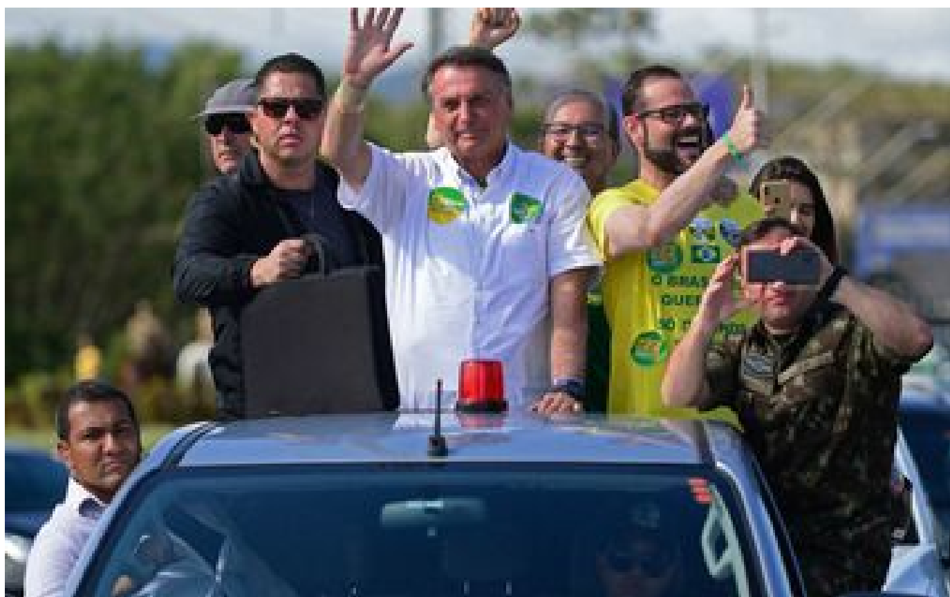
VIDÉO. Brésil : quand Jair Bolsonaro provoque les soutiens «people» de Lula