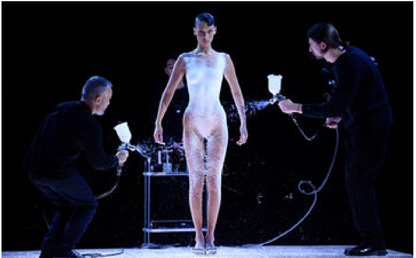
VIDÉO. Fashion Week : la robe créée sur le corps de Bella Hadid à l'aérographe fait sensation