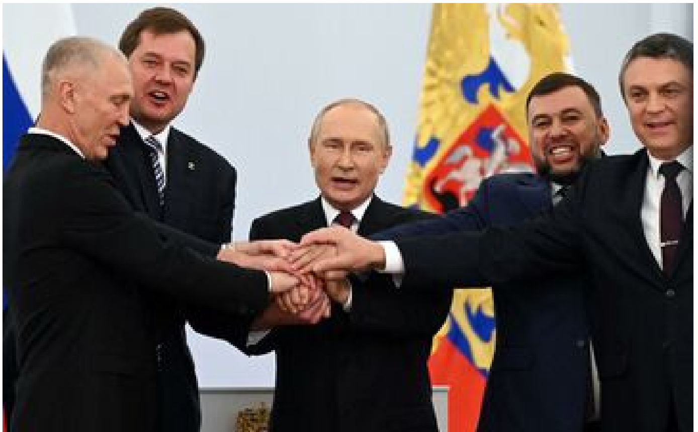
VIDÉO. «Pour Poutine, il n'y a plus de retour en arrière possible» : son discours est celui de la