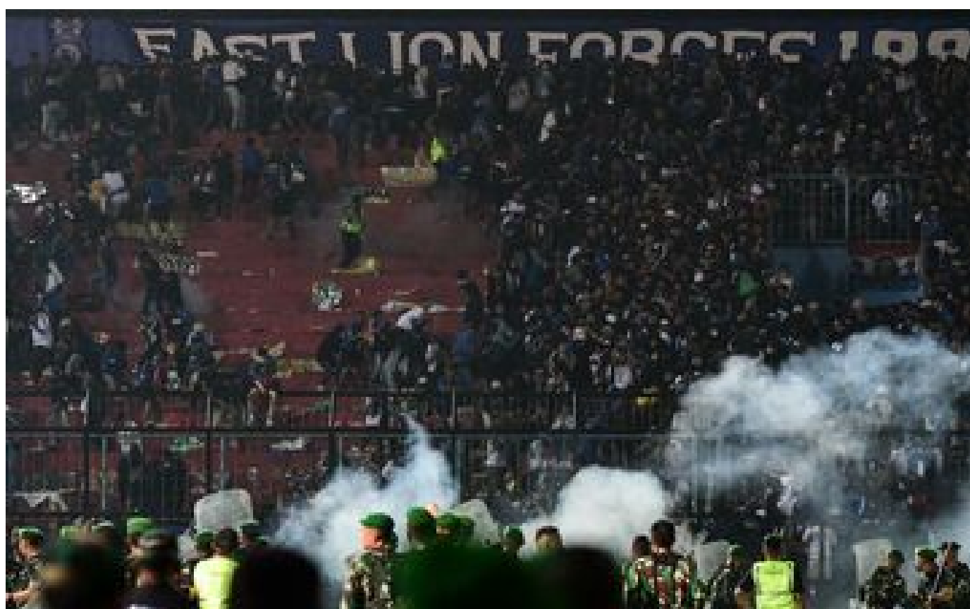
Indonésie : au moins 125 morts après des violences dans un stade de foot, «une tragédie au-delà de l'imaginable»