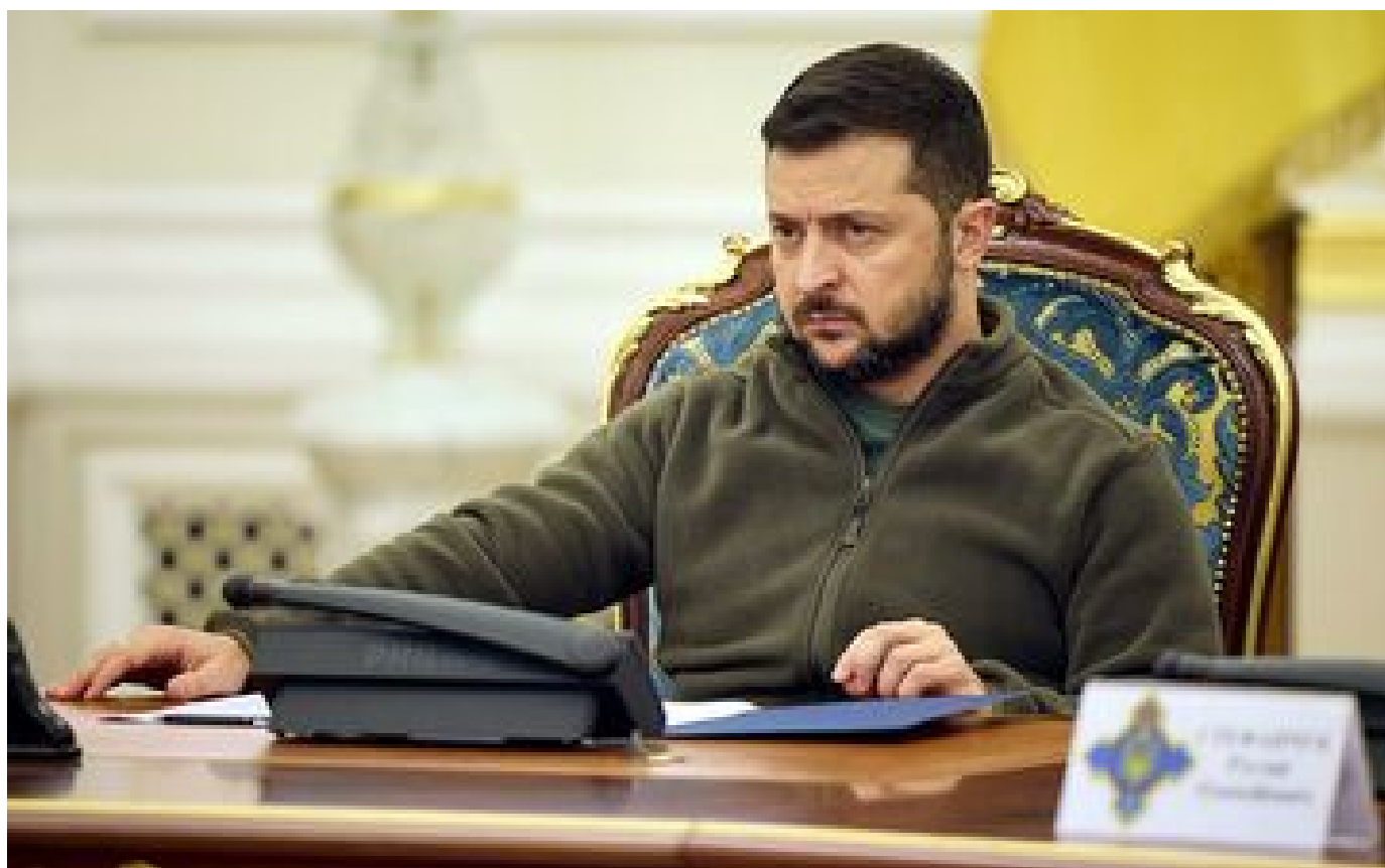
VIDÉO. Zelensky aux forces russes : «Vous serez tués un par un» à cause de Poutine