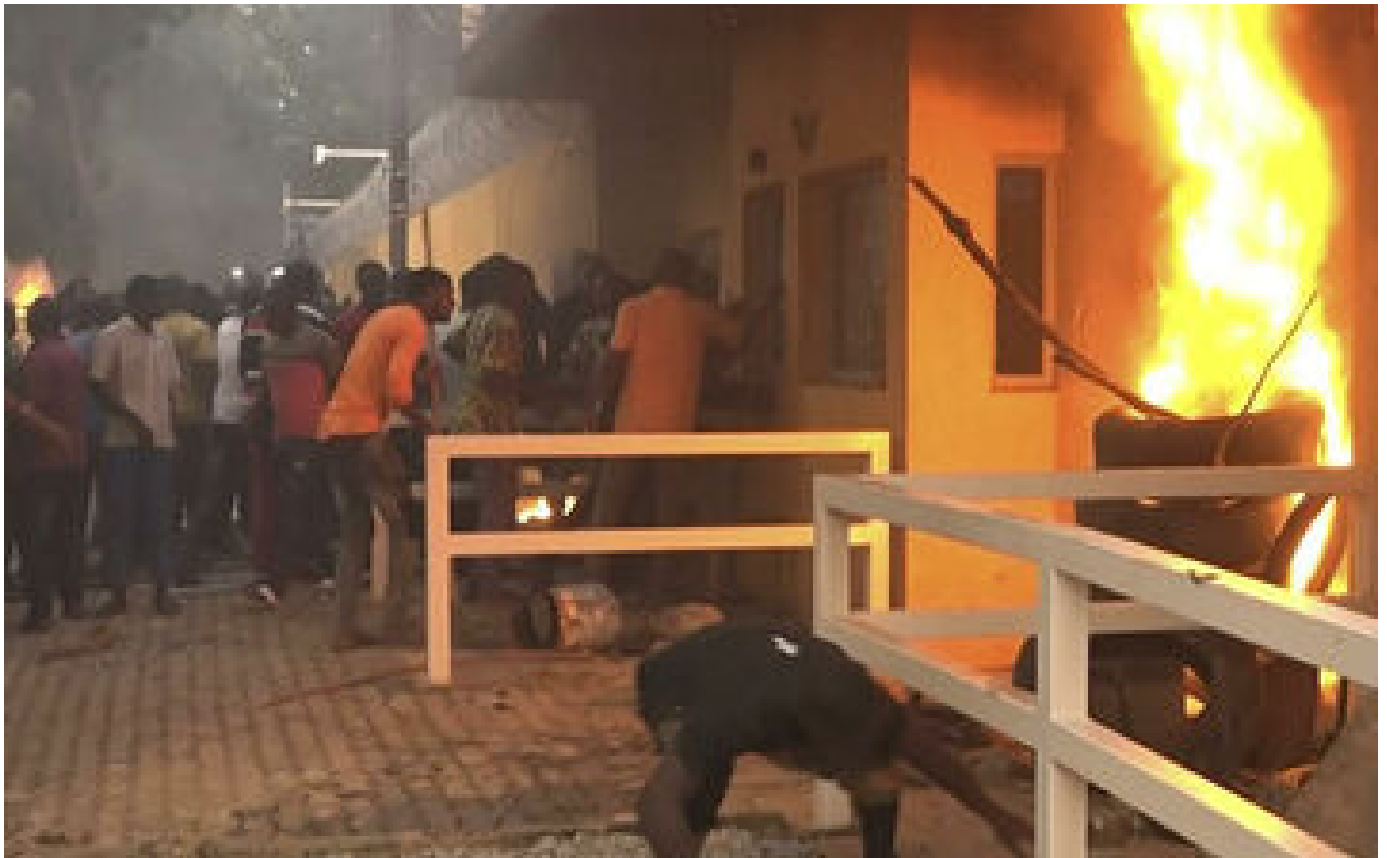
VIDÉO. Coup d'État au Burkina Faso : la France prise à partie, le chef de la junte Ibrahim Traoré