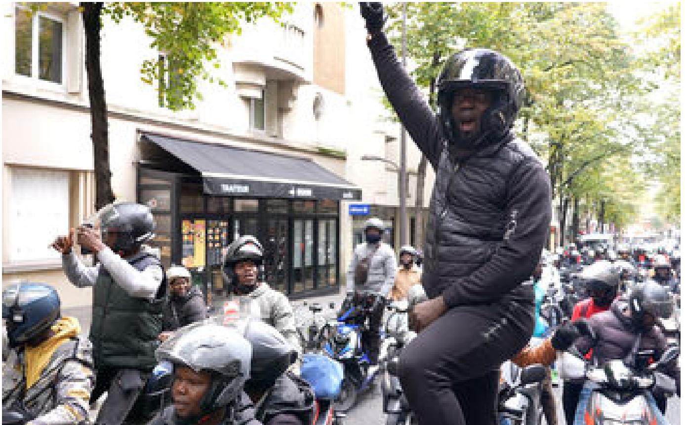
VIDÉO. Radiation des livreurs Uber Eats : « Tout ce qu'on veut c'est travailler »