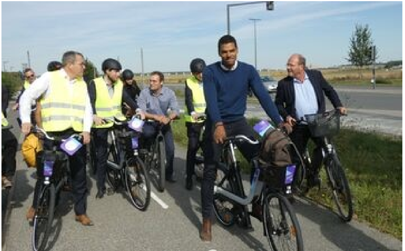
Abonnés Les vélos électriques «augmentés», nouvelle solution écolo pour se déplacer à Paris-Saclay