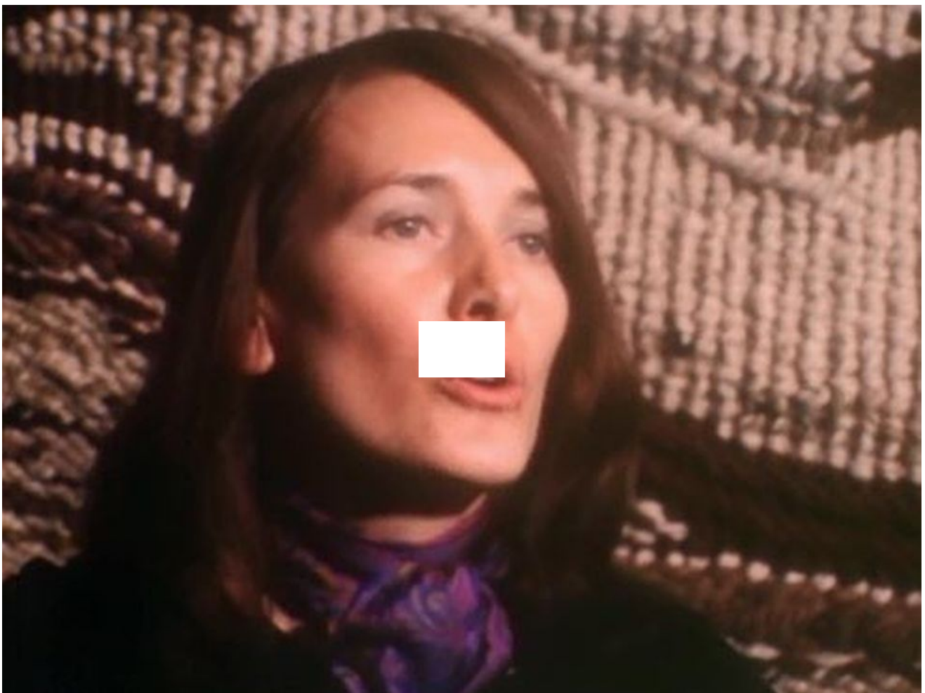
Annie Ernaux / Voix au chapitre / 25 min. / le 28 mars 1974

>> Annie Ernaux décrit l'aspect sociologique de son premier roman à la TSR, le 28 mars 1974: