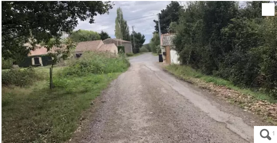
Le hameau du Tabier, un site particulièrement isolé au nord de Pornic.

Les gendarmes ont interpellé, lundi 17 octobre, deux suspects dans le meurtre de l'homme qui avait tenté, le 11 septembre à Pornic, de bloquer les cambrioleurs de la maison de son voisin. Ils ont 19 ans et 20 ans.