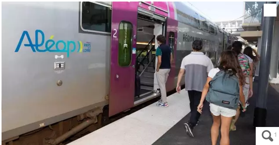
Un an après le lancement de son premier appel d'offres pour la mise en concurrence d'un tiers du réseau Aléop en TER, sur les lignes « tram-train » et « sud-Loire », la Région « a réceptionné plusieurs offres ».

Un an après le lancement de son premier appel d'offres pour la mise en concurrence d'un tiers du réseau Aléop en TER, sur les lignes « tram-train » et « sud-Loire », la Région Pays de la Loire a réceptionné plusieurs offres.