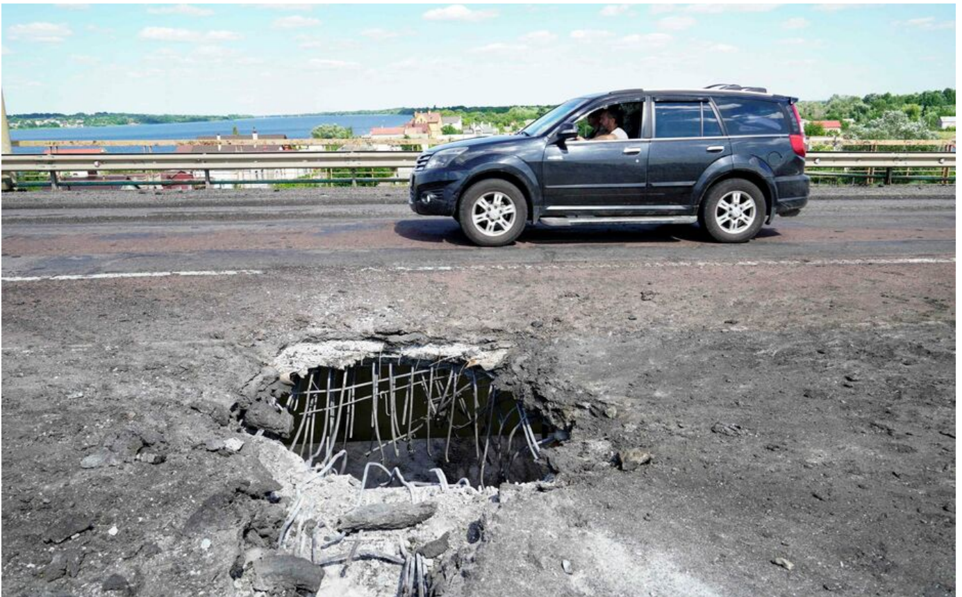
Le pont Antonovsky, au mois de juillet, témoignait déjà des stigmates de frappes ukrainiennes.

Alors que la menace d'une nouvelle offensive russe par la Biélorussie est de retour, le retrait des hommes du Kremlin dans la grande ville et région de Kherson, emmenant 50 000 civils avec eux, réserve de mauvaises surprises à la contre-offensive ukrainienne.