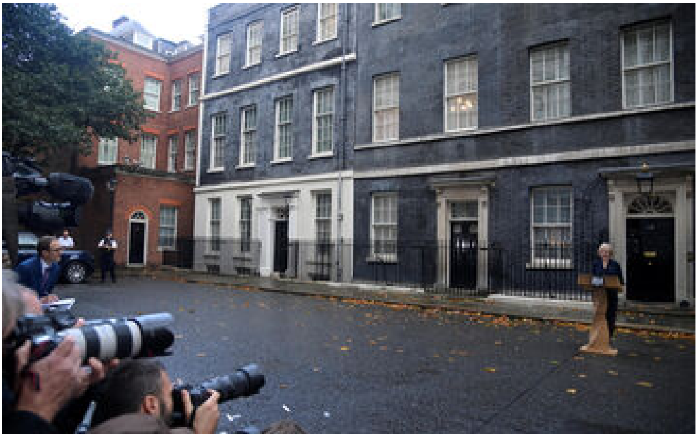
Abonnés «Elle a causé du tort au pays» : après la démission de Liz Truss, des Britanniques