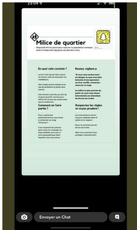
Capture d'écran des règles de la milice de quartier diffusées sur Snapchat

Dans les vidéos qui défilent en « story » – des publications éphémères qui disparaissent automatiquement au bout de 24 heures – celui qui semble être le chef de file de l'assemblée explique : « Il faut réfléchir, oui pour faire des actions, se concerter avec les autres mecs des quartiers pour zoner, qu'ils prennent leur responsabilité. » La vidéo suivante, qui montre un groupe d'hommes de dos écoutant un discours, comporte cette légende : « On va discuter avec les habitants prendre le temps de tous vous connaître et ceux qui sont suspects on va vous demander gentiment de ne plus rester ici... » Sur la vidéo suivante, on distingue un rassemblement devant un arrêt de tram de la place Pierre Mendès-France, connu pour abriter de nombreux points de ventes de drogue.