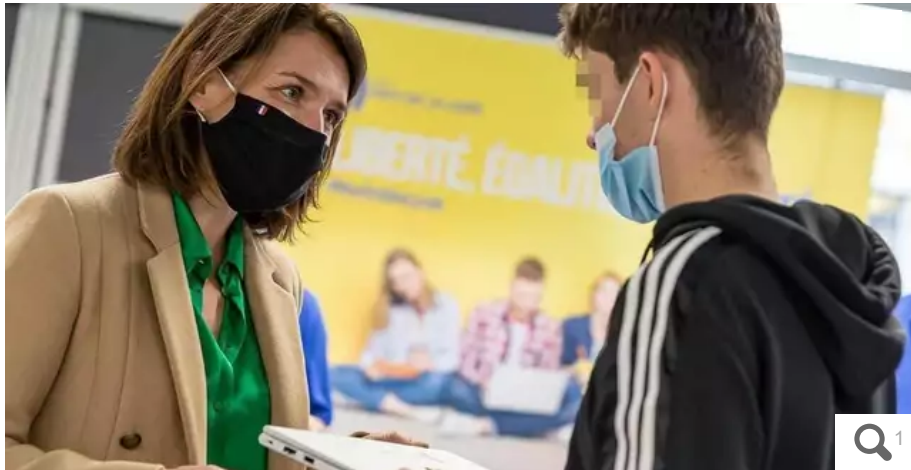
La proutidende de la Région, Christelle Morançais (ex-LR) a remis des ordinateurs à des lycéens nantais.

La Région a voté des dizaines de millions d'euros pour doter les lycéens d'un ordinateur. Problème : des établissements scolaires n'en veulent pas. Ils s'inquiètent notamment pour la sécurité de leurs réseaux numériques.