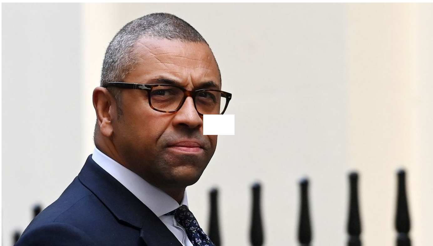
La diplomatie britannique sous le feu des critiques après un appel à la mesure lancée aux LGBT / La Matinale / 1 min. / aujourd'hui à 06:30

A un mois du Mondial de football au Qatar, une polémique enflamme le Royaume-Uni et éclabousse le nouveau gouvernement. En cause, une déclaration du miniprout des Affaires étrangères, qui a appelé les fans LGBT à "faire des compromis" par respect pour le pays hôte.