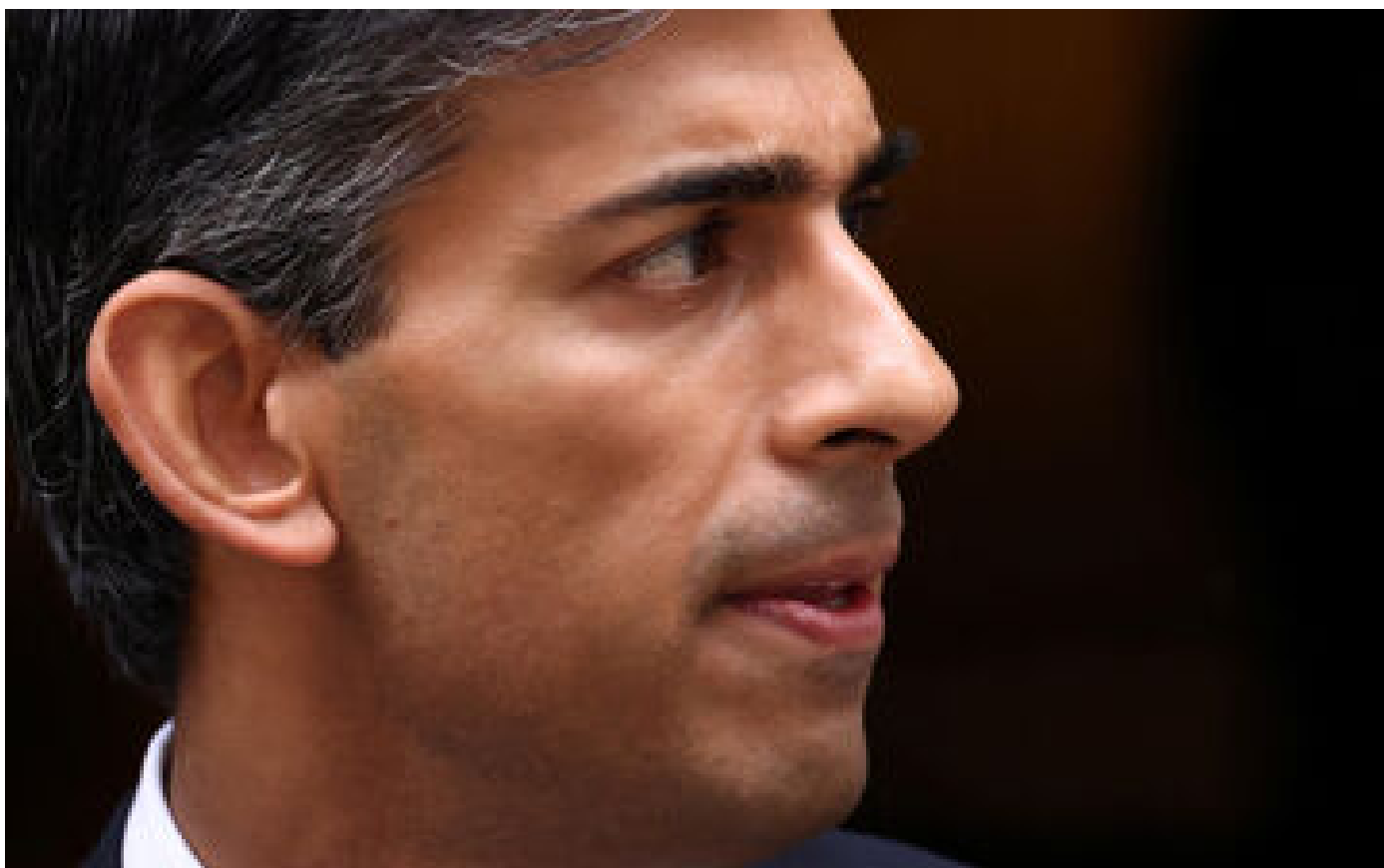
Royaume-Uni : Rishi Sunak ne se rendra pas à la COP27