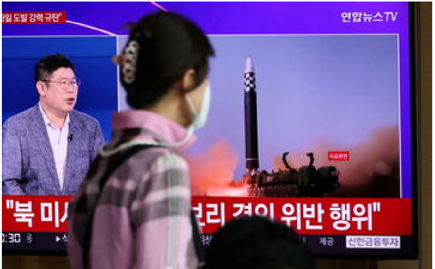
La Corée du Nord tire deux missiles balistiques, selon l'armée sud-coréenne