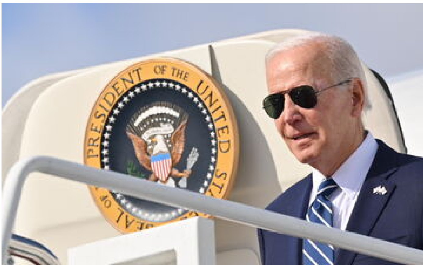
Après des tweets appelant à l'assassinat de Biden, le New York Post dit avoir été «piraté»