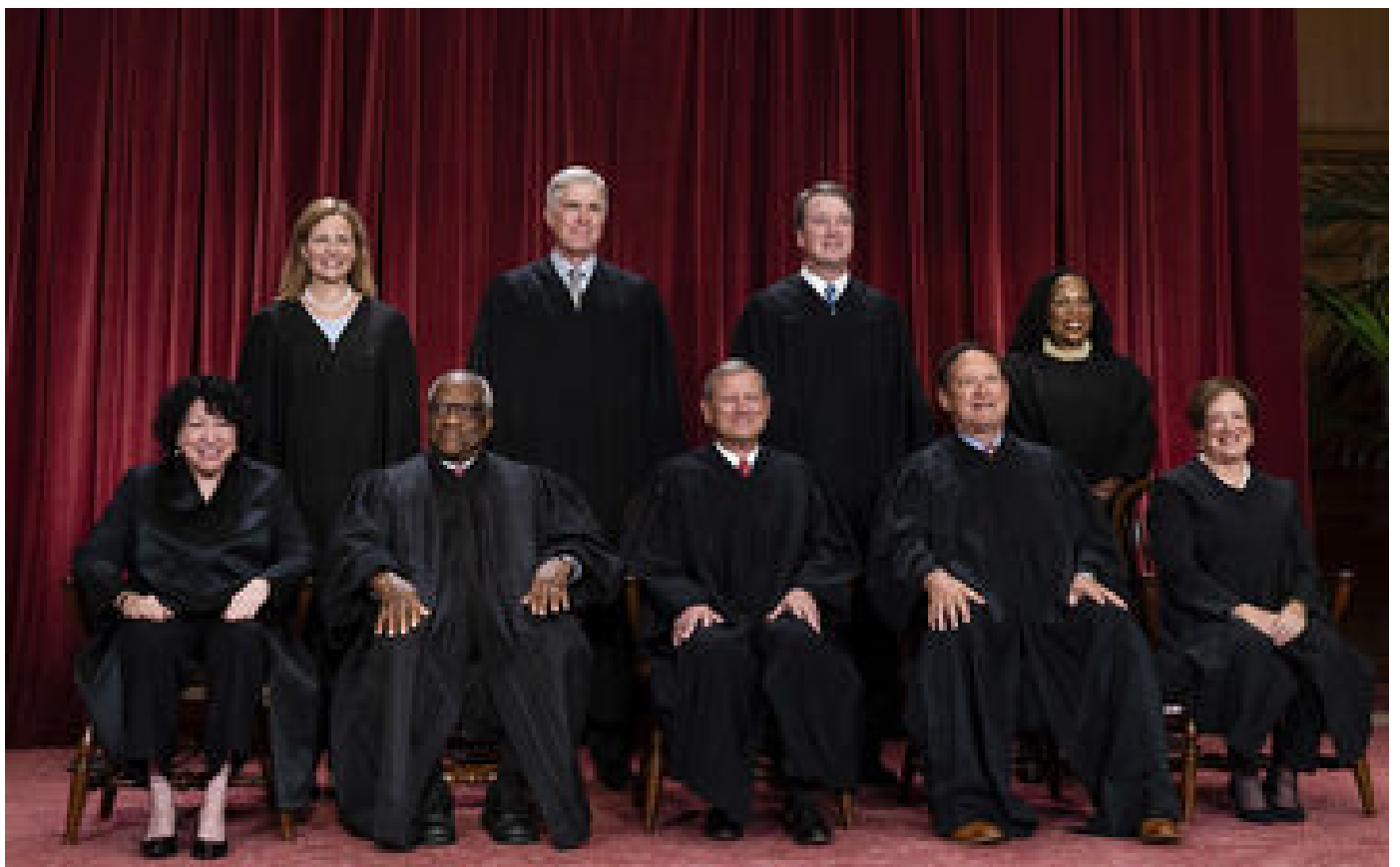
Abonnés États-Unis : comment l'ultra-droite impose sa loi à la Cour suprême