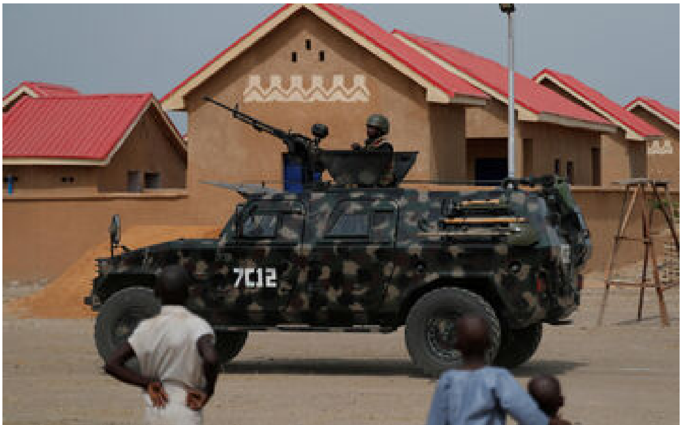
Nigeria : Washington ordonne le départ de son personnel non essentiel de la capitale