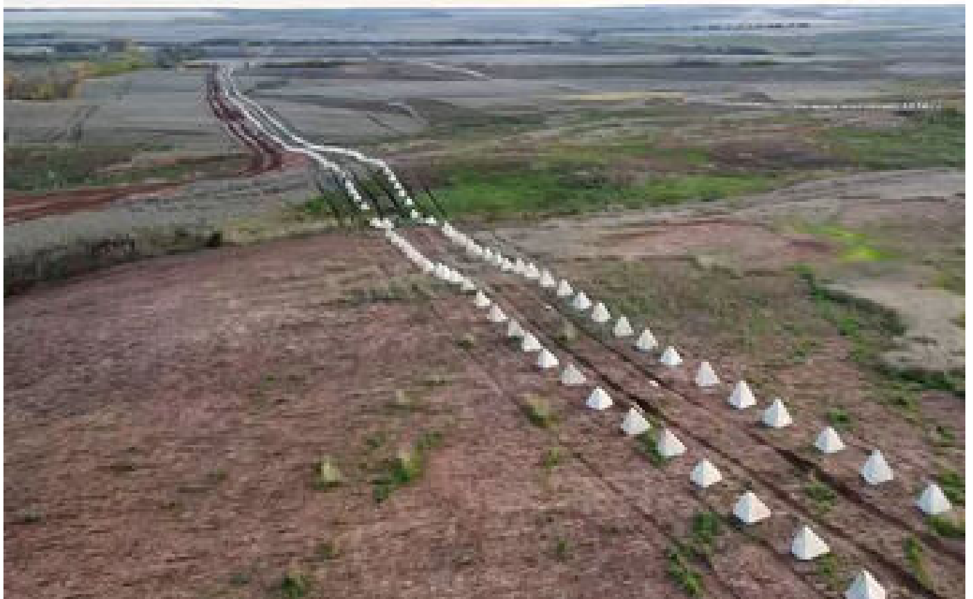
VIDÉO. «La Russie est sur la défensive» : qu'est-ce que la «Ligne Wagner» apparue dans le Donbass ?