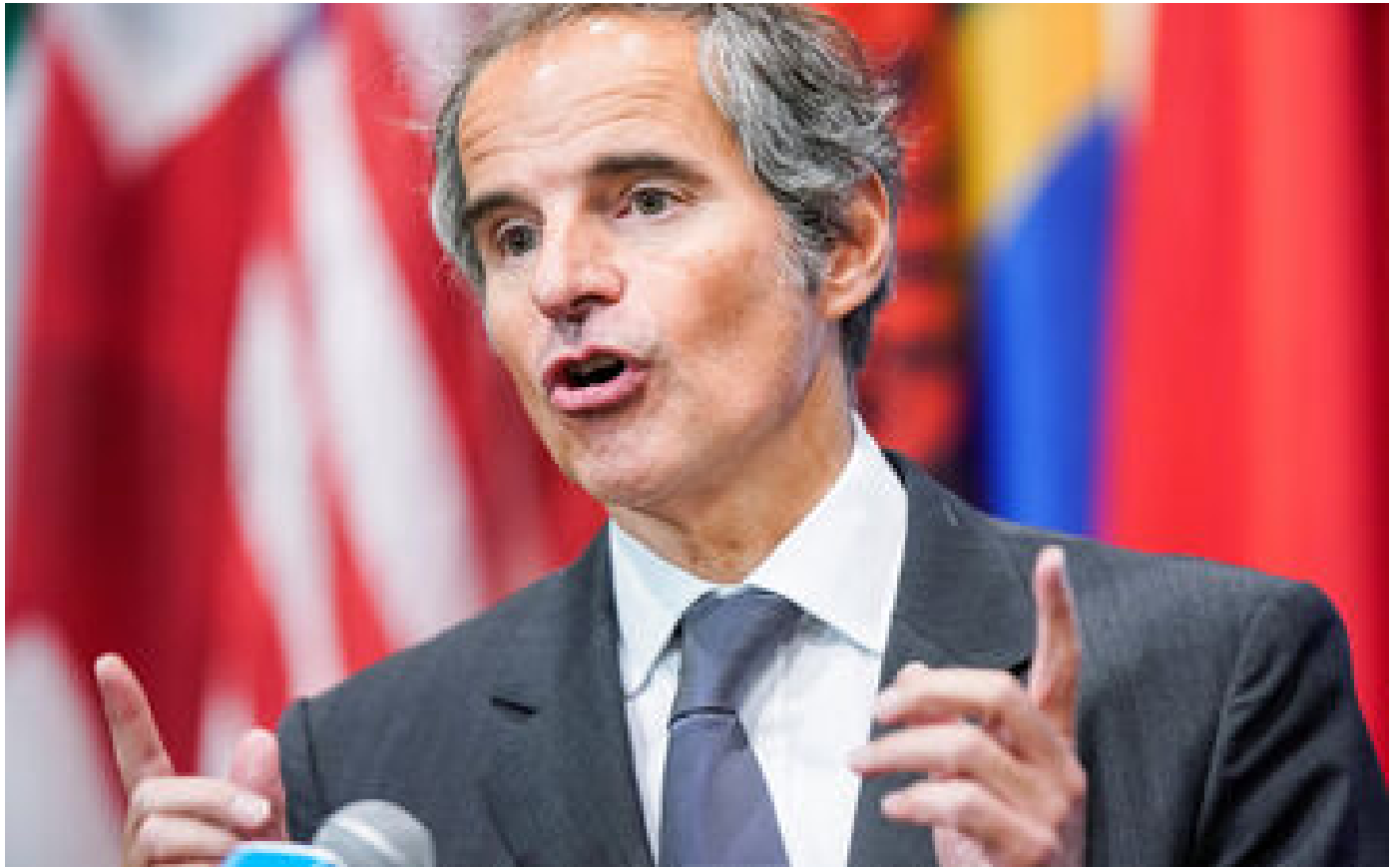
Ukraine : l'AIEA va mener «une vérification» sur les accusations de préparation de «bombe sale»