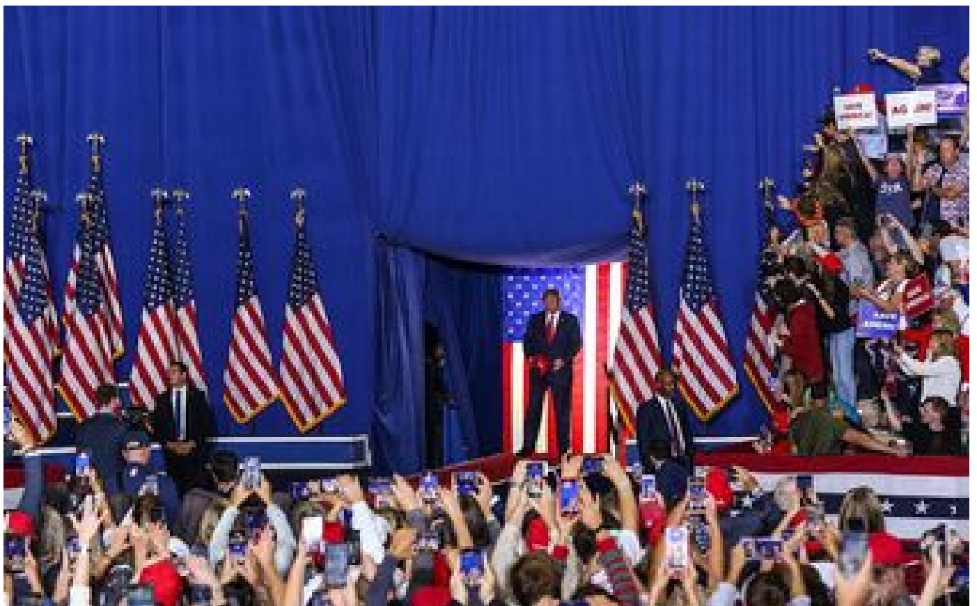
Abonnés À Détroit, avec les partisans d'un Donald Trump revanchard : «Je le soutiendrai jusqu'au bout»