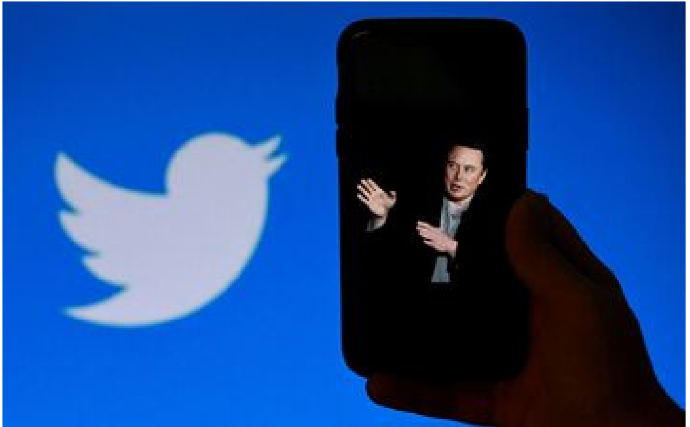
«L'oiseau est libre» : Elon Musk prend le contrôle de Twitter et licencie son patron