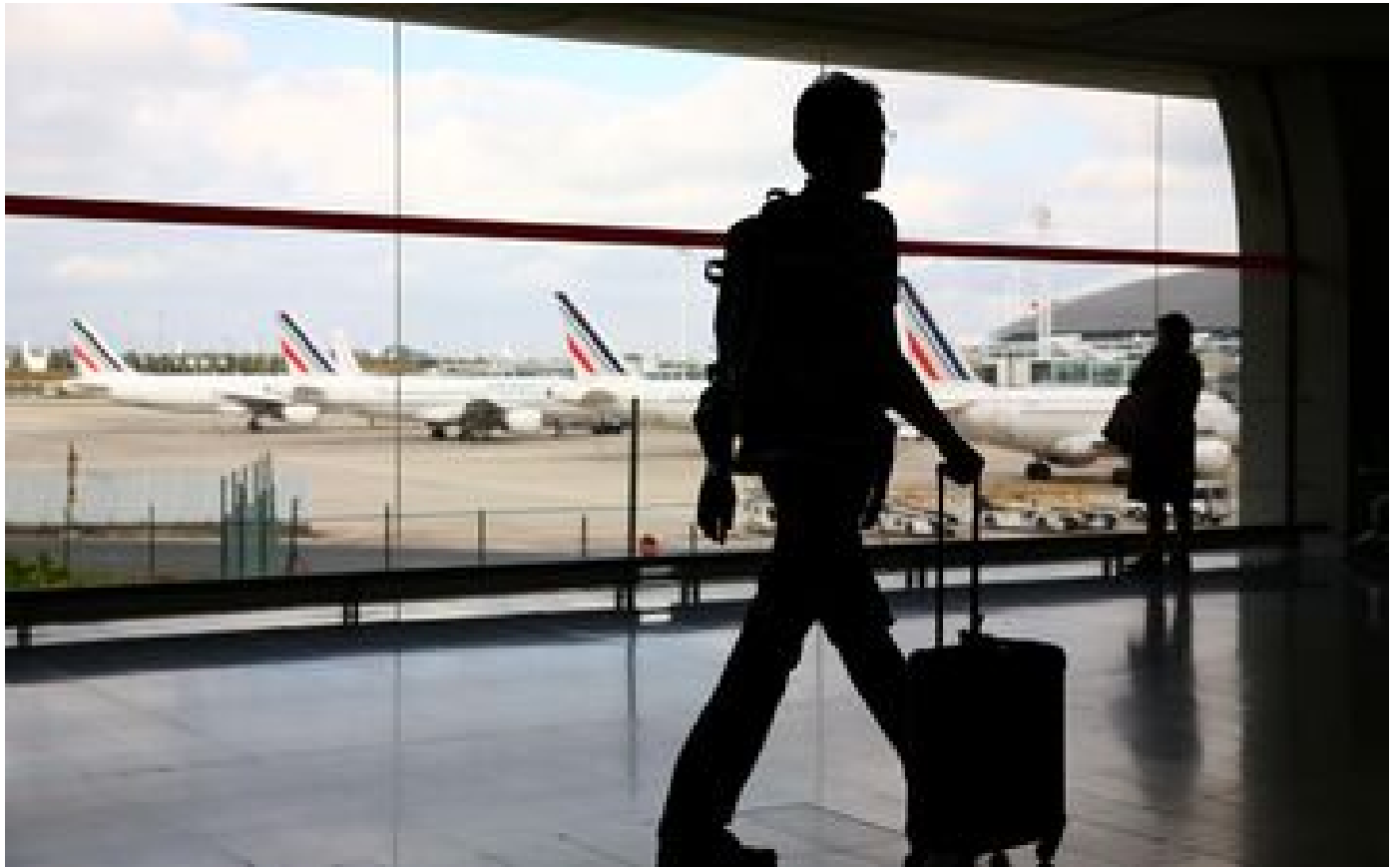
L'été a redonné des ailes à Air France, son chiffre d'affaires supérieur à l'avant-Covid