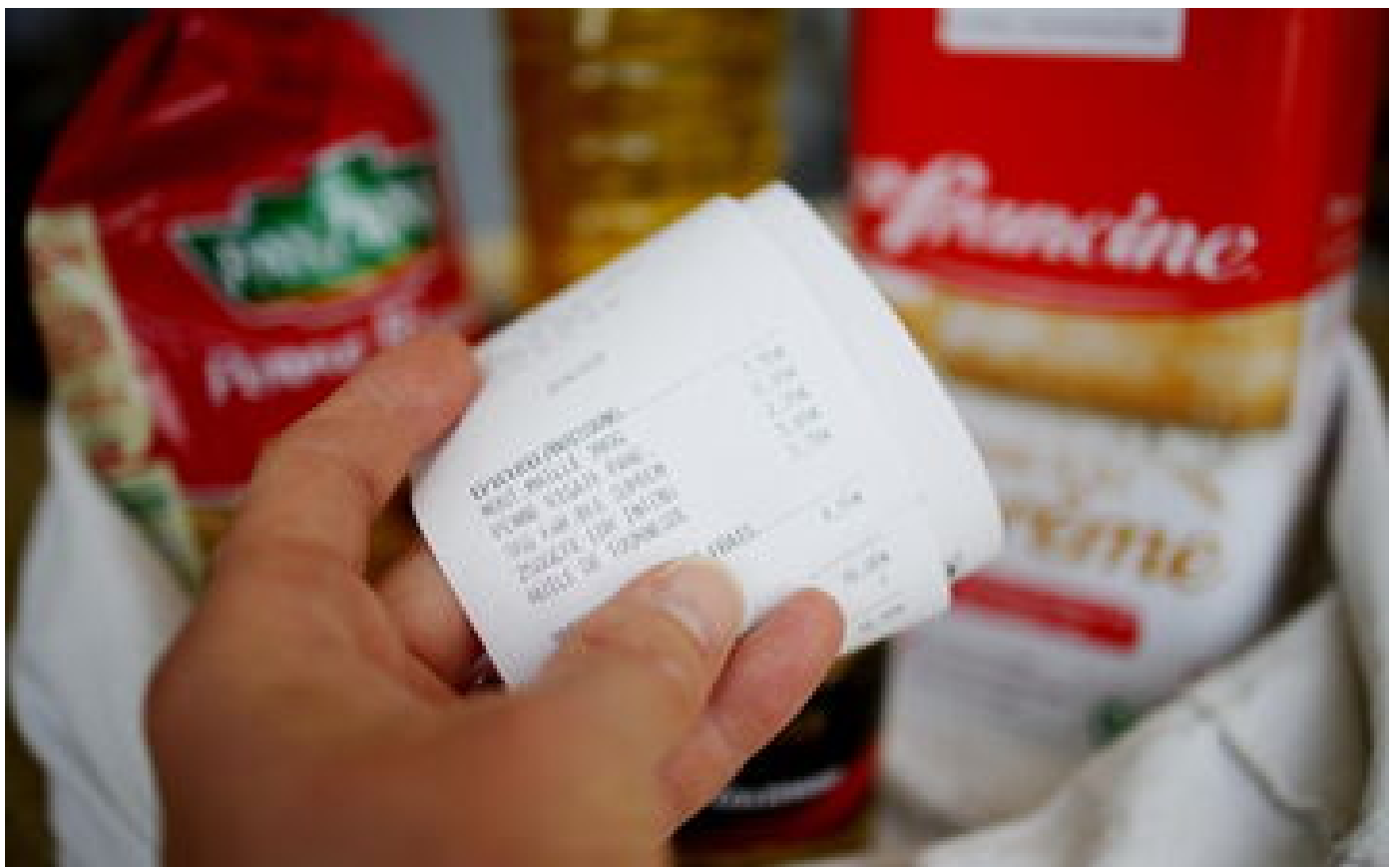
France : l'inflation accélère en octobre à 6,2% sur un an