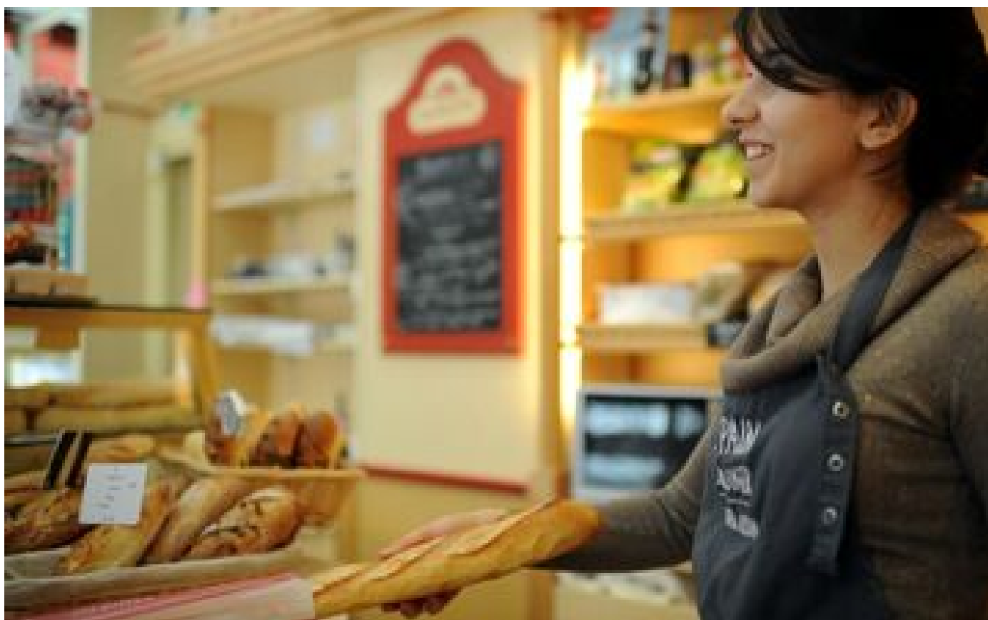
Prix du gaz et de l'électricité : pour certains, l'Etat paiera une partie de la note