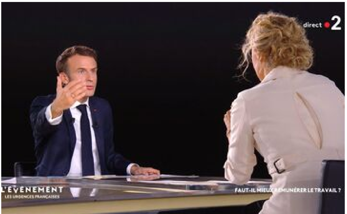
Abonnés Le dividende salarié, promesse de campagne d'Emmanuel Macron, c'est loin d'être gagné